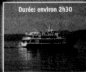
Durée: environ 2h30

Départs de Tadoussac et Baie-Sainte-Catherine