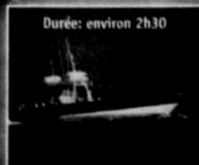
Durée: environ 2h30