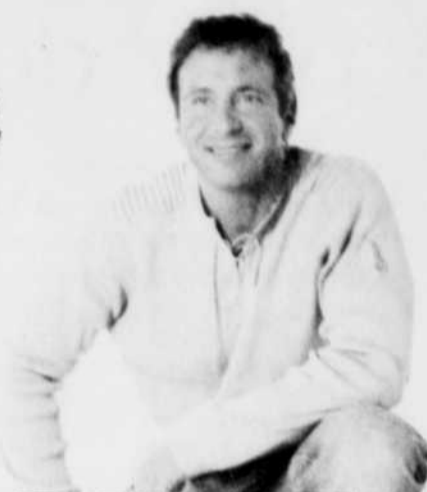
Alain Choquette et vous... drôlement intime

L'événement marquant des festivités entourant le onzième anniversaire du casino sera sans contredit le spectacle d'Alain Choquette, qui sera présenté dans la salle de bal du Fairmont Le Manoir Richelieu, du 23 juin au 10 juillet. Après avoir fait un malheur à Las Vegas, le célèbre prestidigitateur québécois a décidé de monter un spectacle plus épuré, intitulé Alain Choquette et vous... drôlement intime , qui est conçu pour des salles de toutes les dimensions.