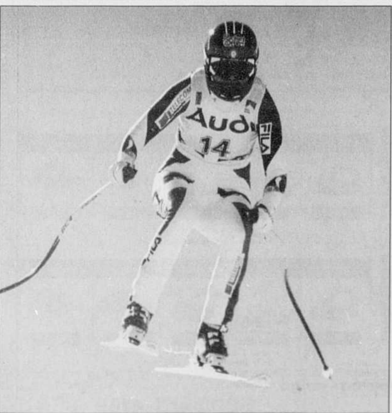
L'Italienne Isolde Kostner en plein vol.

D'ailleurs, l'Américaine Picabo Street, interrogée à ce propos, a cité le nom de l'Italienne en premier. «On devrait retrouver les mêmes dix premières, ajoutait-elle. J'ai cité d'abord Isolde parce qu'elle a gagné aujourd'hui.»