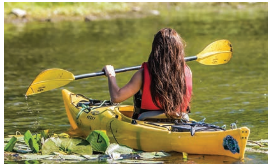
PHOTO RAPPORT ANNUEL / SOCIÉTÉ DES ATTRACTIONS TOURISTIQUES DU QUÉBEC

La Société des Attractions Touristiques du Québec prend des moyens pour contrer la rareté de la main-d'oeuvre.