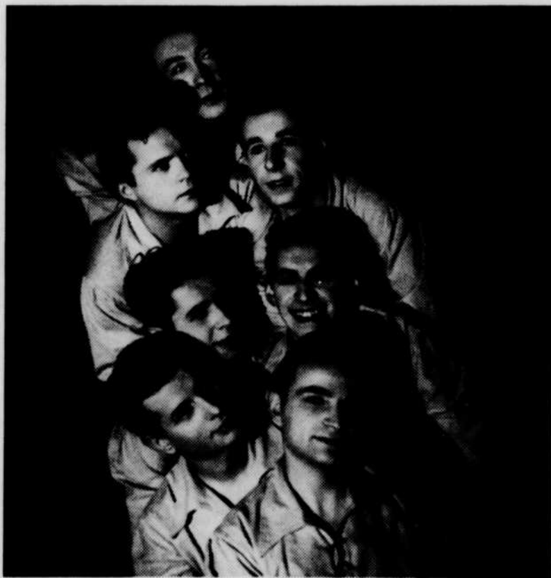
Les Compagnons de la musique, célèbre ensemble choral de France et initiateurs de la chanson animée, qui feront leurs débuts à la radio canadienne, mercredi soir, à 9 heures. Ils se joindront à la nombreuse équipe de Radio-Carabin .

Rappelons que c'est durant l'occupation de la France que les Compagnons de la musique ont été constitués et que leur répertoire compte les airs enlevants qui rallièrent les groupes de la Résistance. Depuis la libération, ils ont été entendus dans les plus grandes salles d'Europe, souvent en compagnie de grandes vedettes, et ils ont enregistré nombre de leurs chansons. Le style des Compagnons de la musique se prête admirablement à l'audition radiophonique, car aux effets vocaux, ils ajoutent le rythme produit par le martèlement des pieds et le claquement des mains.