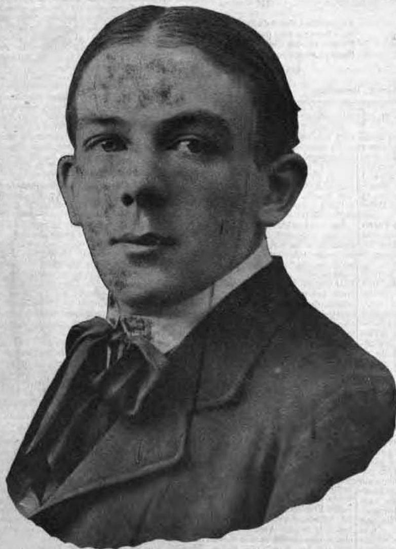
MALLET DU QUIMETOSCOPE