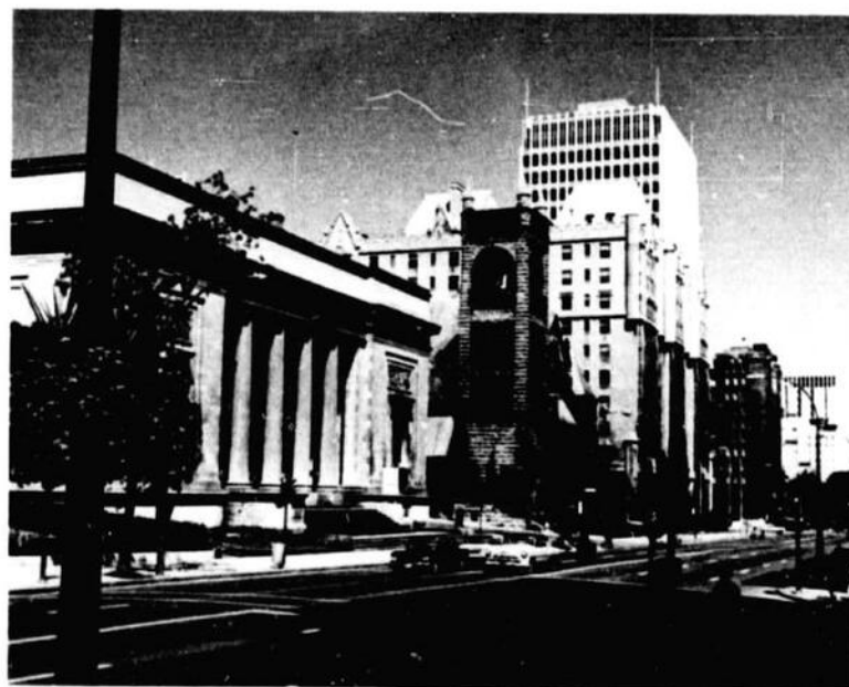
Montreal Museum of Fine Arts, Sherbrooke Street West Musée des Beaux-Arts de Montréal, rue Sherbrooke ouest

L'autoroute panoramique des Laurentides, commencée en 1956 et terminée en 1973 jusqu'à St-Jovite, part de Montréal à la sortie 17 du boulevard Métropolitain, relie Montréal à l'Ile-Jésus, traverse la rivière des Mille-Iles jusqu'à Rosemere. Elle est une route à double voie avec cinq postes de péage, 67 ponts et croisements pontés.