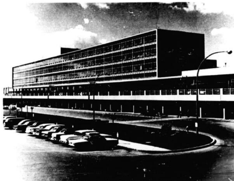
Aéroport International de Montréal, Dorval

son's Bay Company in 1821. British traders were consolidated before and during the last decade of the eighteenth century. In 1804 the Phoenix Fire Insurance Company, the first insurance company in Canada, started here. In 1809 the S.S. "Accommodation" was built by John Molson, of Montreal, for river traffic, the second steamer on North American rivers, and three years before any such steamer plied in England. The Bank of Montreal opened for business on November 13th, 1817. The Committee of Trade, the predecessor of the Montreal Board of Trade of 1842, was organized in 1822. The Lachine Canal, begun on July 17th, 1821, was finished in 1825. The first Harbour Commission was appointed in 1830. In 1831 the "Royal William" was fitted with its engines in the yards of Bennett & Henderson,