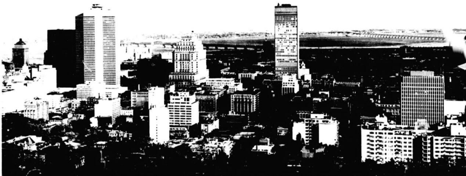
General view of Montreal from Mt. Royal