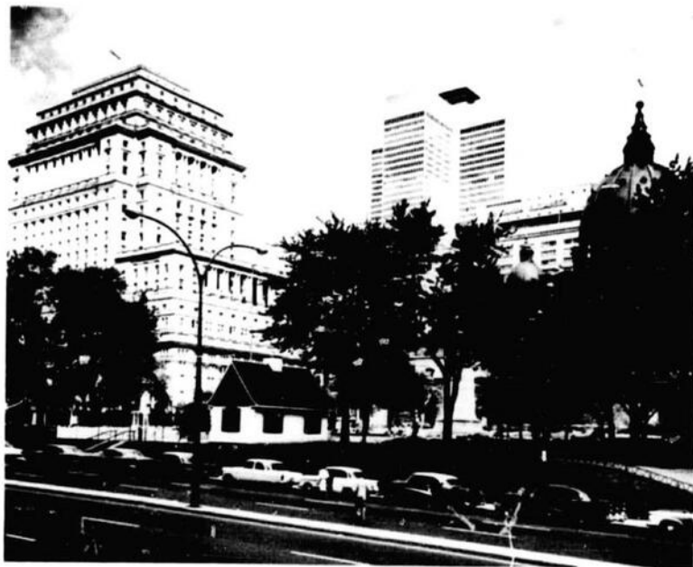
Place du Canada

30 miles long and 7 to 10 miles wide, with an area of 194 square miles. The present City covers over 43,734 acres, having, by annexation, especially in 1883, grown from the 5,000 acres of 1860. It occupies one-quarter of the island and is 68 square miles in area.