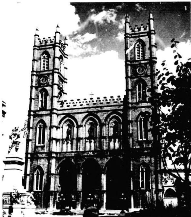
Notre Dame Church, Place d'Armes

The City, at the end of the struggle between France and England for supremacy of North America, capitulated on September 8th, 1760. During the American Revolution, the city was held by the Congress troops from the capitulation of November 13th, 1775, until evacuated by Benedict Arnold in June, 1776. After this trade began to develop: the Northwest Company, fur traders, was established at Montreal in 1783-4, the "X.Y." in 1795-1804, and both amalgamated with the Hud-