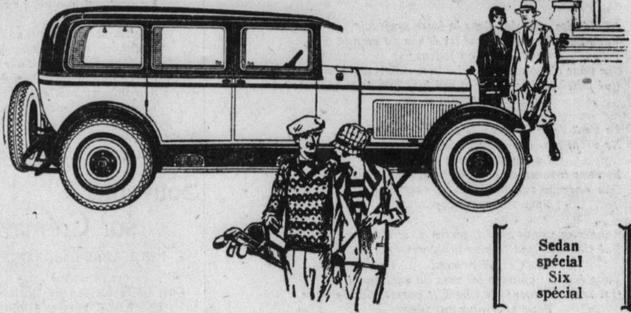
Sedan spécial Six spécial

tient la tête dans le domaine de l'auto.