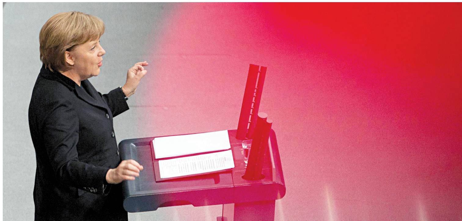
Le gouvernement d'Angela Merkel a eu la mauvaise surprise de voir sa dernière émission d'obligations lui rester en bonne partie entre les mains.