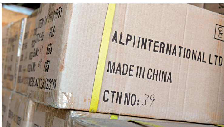
Les exportations vers la Chine et les États-Unis ont diminué en octobre.