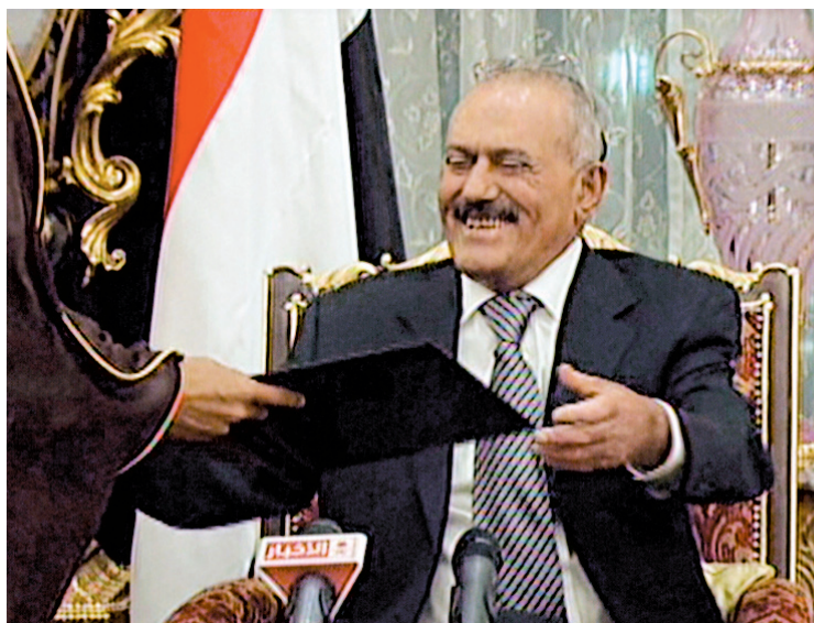
Ali Abdallah Saleh, hier, à Riyad

S'il quitte effectivement le pouvoir, il sera le quatrième chef d'Etat arabe à être emporté par la contestation de la rue