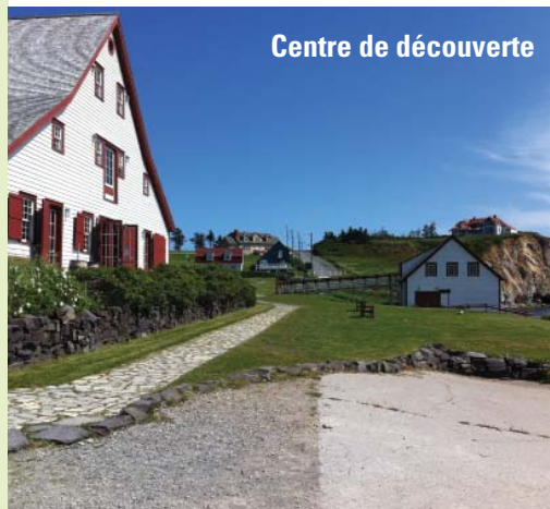
Centre de découverte

* Jours de mauvais temps - Du 7 juillet au 17 août Lors des journées de mauvais temps, où il est impossible d'accéder à l'île, les naturalistes vous offrent des activités divertissantes à La Saline.