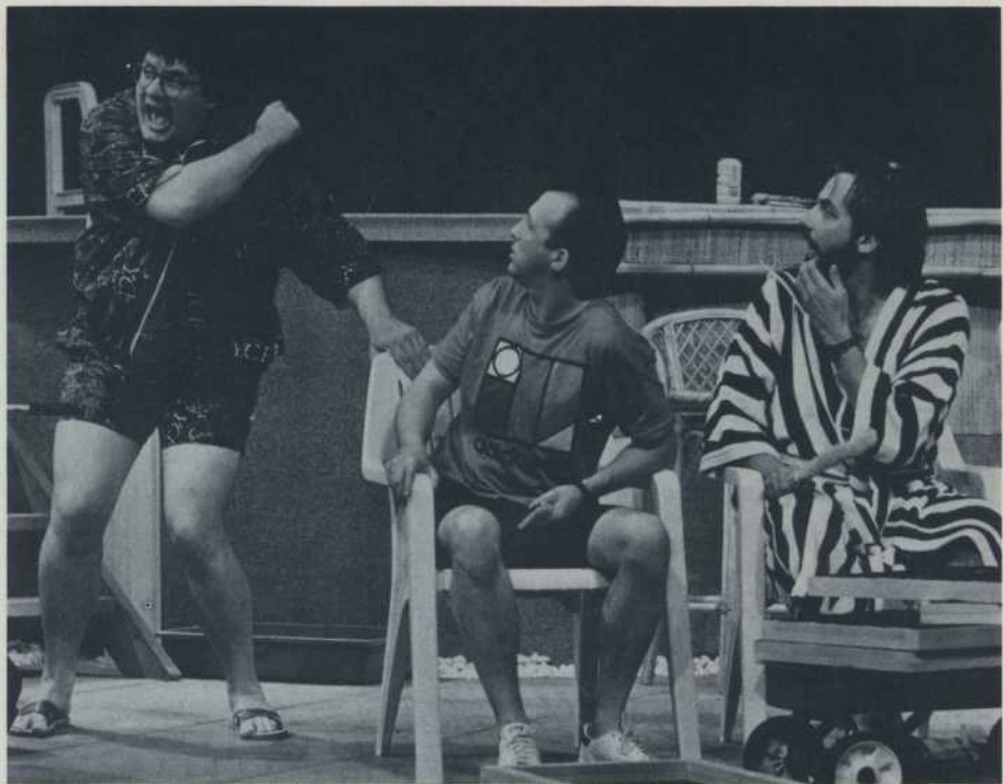
Photo de répétition