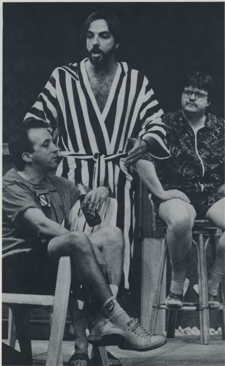
Photo de répétition