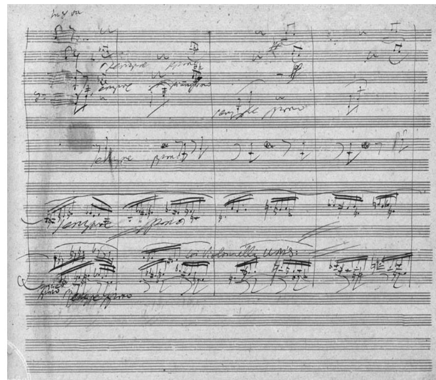
Manuscrit de la Symphonie n° 9