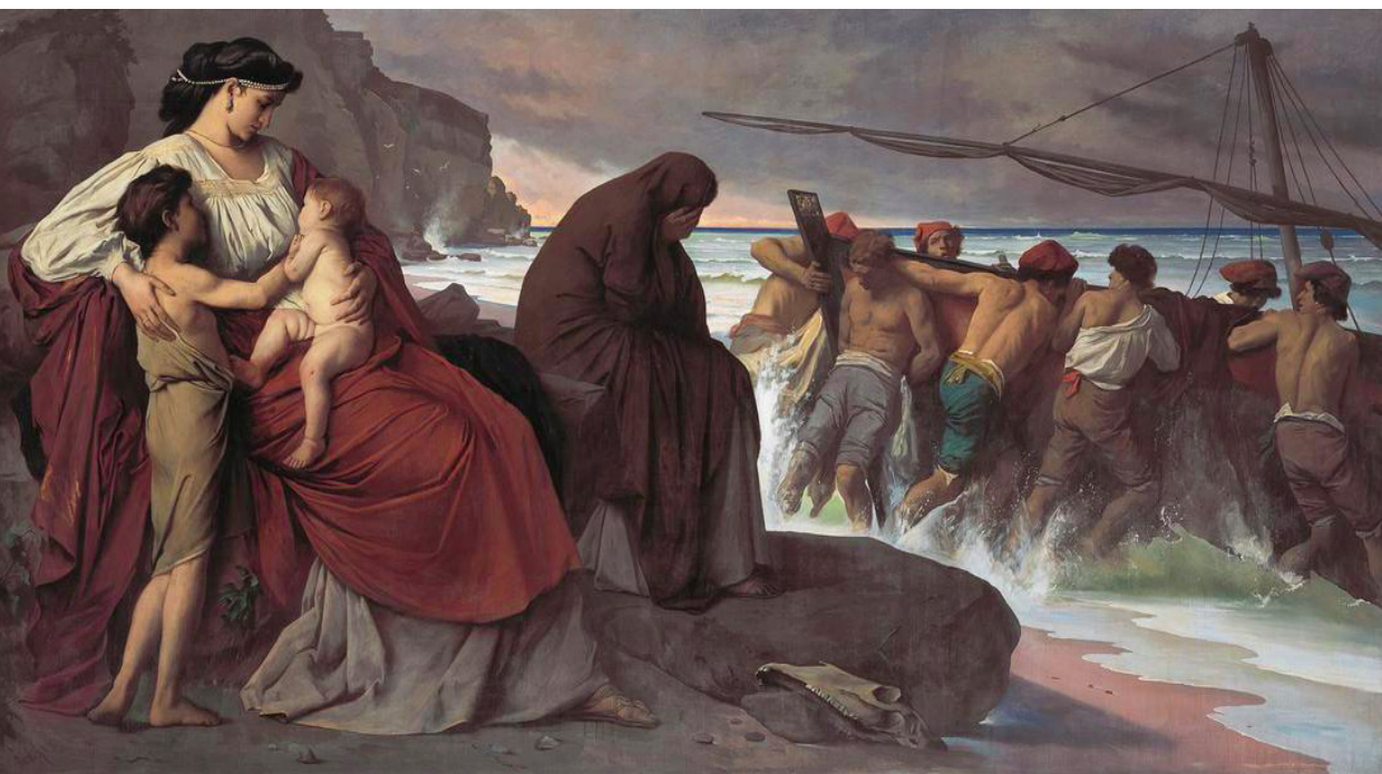
Anselm Feuerbach, Medea (1870). Neue Pinakothek, Munich