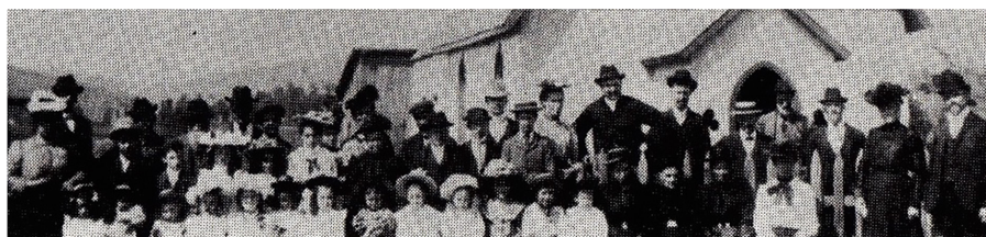
Album du Protestantisme français, I, p. 89

La curiosité des Canadiens français pour le protestantisme évangélique pourrait donc de prime abord se résumer d'une formule : l'audace, sinon l'héroïsme, des timides. Pour leurs premières prises de contact avec « la nouvelle religion » 3 , il leur fallait en effet déjouer la surveillance étroite du prêtre de la paroisse et souvent, du voisinage. Dans les rapports annuels des Églises baptiste ou presbytérienne 4 , les exemples sont innombrables d'assemblées de prières aux effectifs subitement augmentés lorsqu'elles se tenaient à la nuit tombée, y compris à Roxton Pond, qui comptait