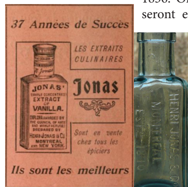
Le Semeur, ACFCE, Montréal, 1907

Les recensements du Canada, via Ancestry.ca