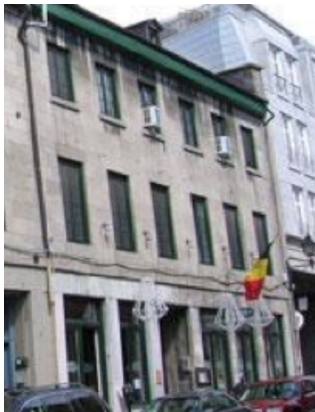
Le 139 de la rue Saint-Paul aujourd'hui

Il fabrique aussi des huiles essentielles, des essences, les parfums et colorants pour les épicerie ou marchands de vin, et du ketchup, des sauces, de la glycérine, et importe de l'huile de castor, de foie de morue, d'olive, fabrique aussi des sirops de fruit, une grande variété d'articles pour confiseur, prépare sur place des variétés de moutarde, tous ces produits généralement connus comme « grocers' sundries ». Il fait aussi venir de l'étranger des préparations en pots comme les cornichons et autres