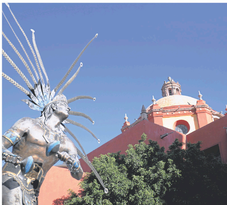
J'ai eu un coup de cœur énorme pour la magnifique statue du danseur Conchero, près de l'église Saint-Francis.

Surtout, ce sont les monuments historiques qui retiennent l'attention dans la vieille ville. On en trouve plus de 1400, dont les nombreuses églises, qui comportent presque toutes un panneau signalétique quelque part près de l'entrée. C'est sans compter l'impressionnant aqueduc, long de 1,2 km, construit entre 1726 et 1738. Cet emblème de Santiago de Querétaro compte 74 arches et il peut être observé d'un observatoire aménagé à une extrémité de la vieille ville.