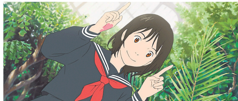
Mirai, ma petite sœur est une fable à l'imagination débordante, visuellement foisonnante et à la graphie très maîtrisée.

Pour son huitième long métrage, Mamoru Hisoda ( Le garçon et la bête ) amalgame à