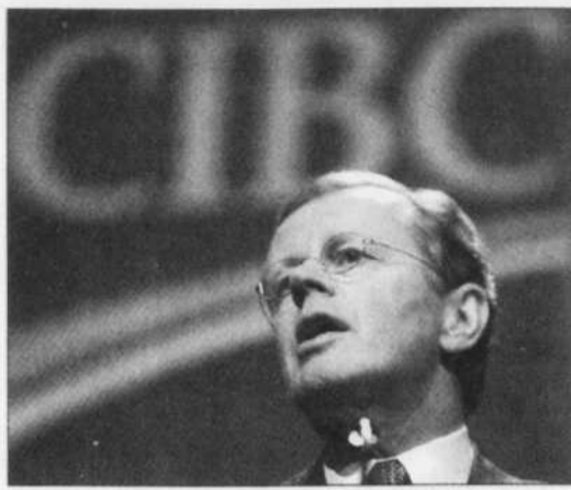
MIKE CASSESE REUTERS

L'ex-président de la CIBC, John Hunkin, est parti à la retraite avec une petite gratification de plus de 50 millions.