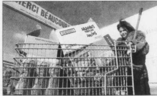
Les commerces de détail et de gros ont contribué à la progression du PIB en octobre.