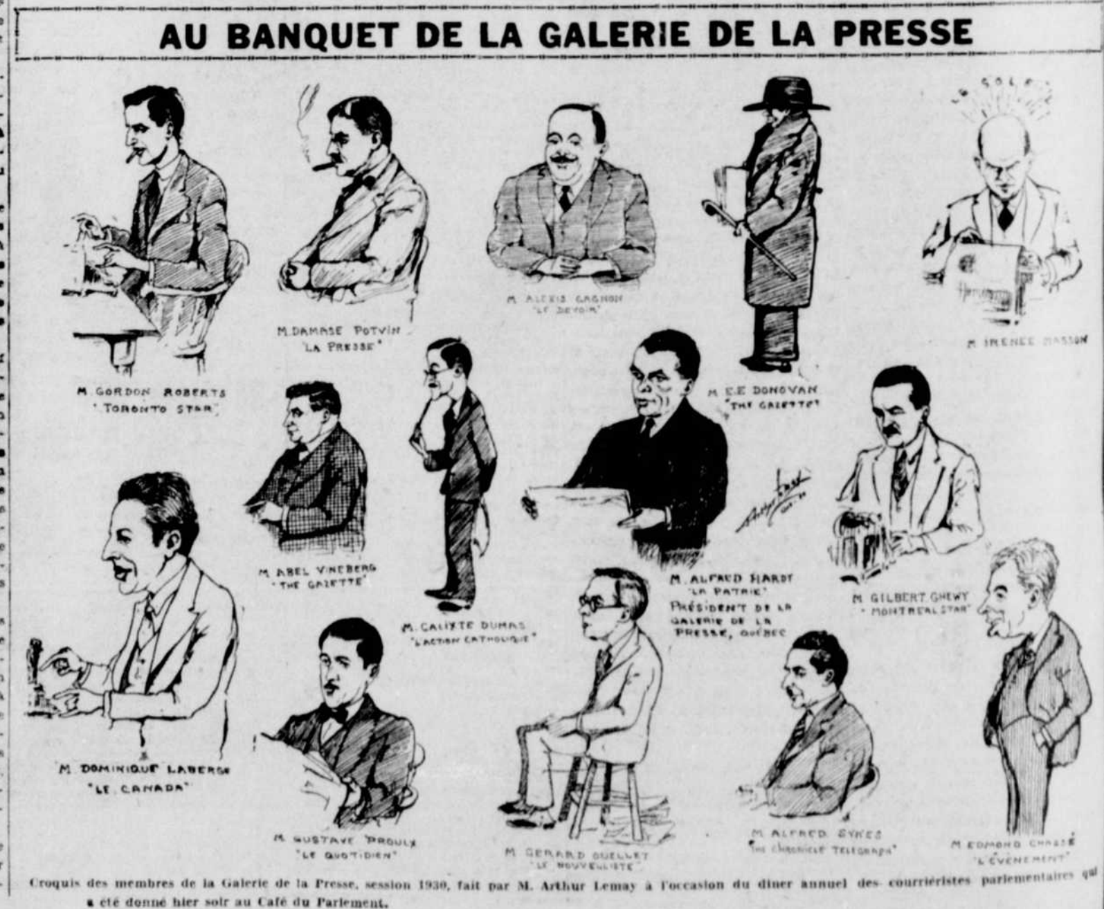
Croquis des membres de la Galerie de la Presse, session 1930, fait par M. Arthur Lemay à l'occasion du dîner annuel des courrieristes parlementaires qui a été donné hier soir au Café du Parlement.