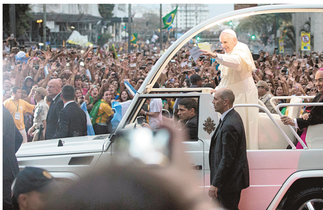
Le pape François a sillonné les rues de Rio de Janeiro lundi sous la clameur populaire.

À lire : Une verison longue de ce texte est disponible à LeDevoir.com