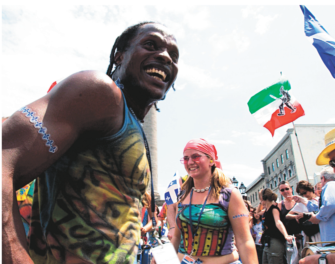
Accueillir de nouveaux arrivants et les sélectionner selon différents critères, dont la maîtrise du français, est relativement facile. En revanche, s'occuper de leur intégration semble ardu.

Mais est-ce que le fait de parler la langue de la majorité fait en sorte que l'intégration se fera plus facilement? Que ces personnes trouveront un emploi dans leur domaine de compétence, pour lequel on les a choisies, plus rapidement que ceux qui doivent passer par la francisation, et ce, même lorsqu'ils commencent au niveau débutant? Pas tout à