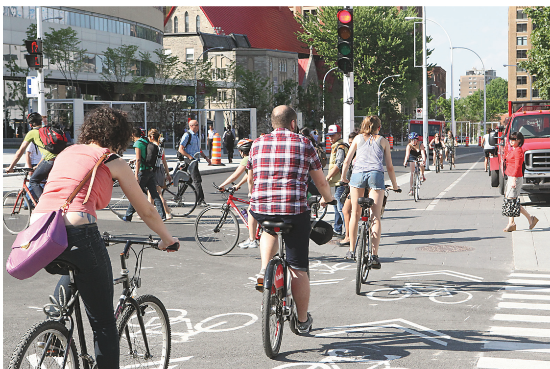
JACQUES GRENIER LE DEVOIR

Cette chronique fait relâche pour l'été. Elle sera de retour le 27 août.