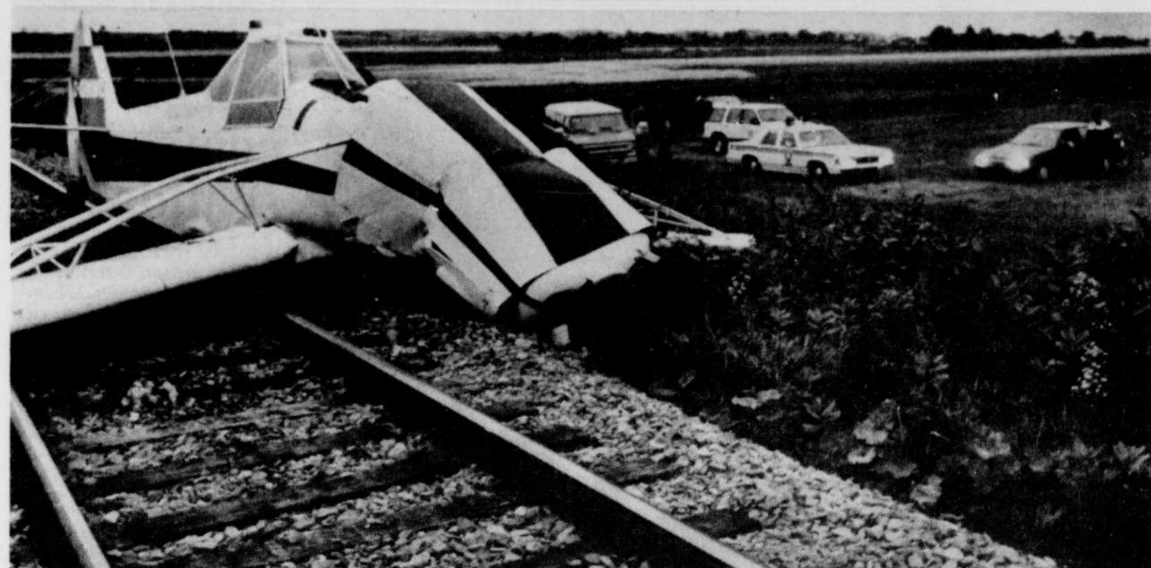
Le pilote venait à peine de décoller avec un réservoir chargé de pesticide, quand son Piper pris dans une bourrasque de vent, a piqué du nez sur ce tronçon de voie ferrée. Il s'en est tiré avec un bon choc nerveux.

tion et de la Sécurité publique continue de scruter à la loupe tous les moyens pouvant assurer une sécurité accrue des enfants dans leurs déplacements entre la maison et l'école. Elle parle notamment de cours de formation pour les chauffeurs d'autobus et d'améliorations possibles aux équipements de transports. Selon la porte-parole de M. Elkas, le comité interministériel devrait bientôt faire connaître ses recommandations.