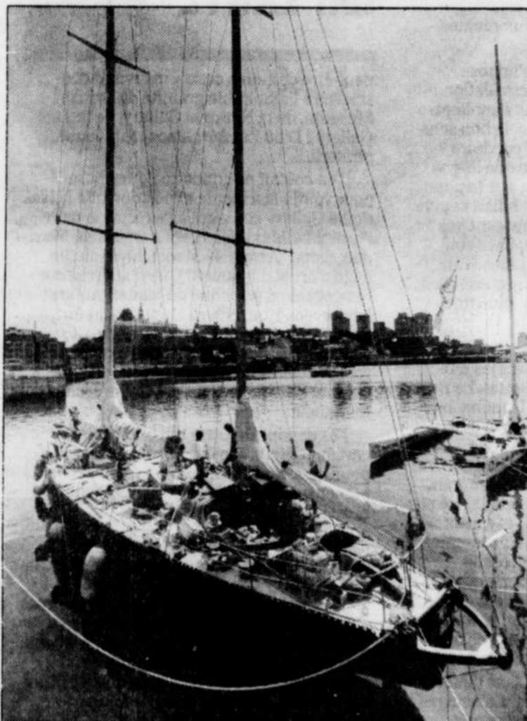
Les gens peuvent côtoyer et engager la conversation avec les plus grands skippers au monde et leurs équipiers.