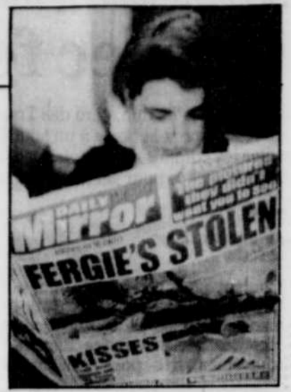
La première page du Daily Mirror a été entièrement consacrée, hier, à cette affaire.

une claire différence avec Clinton qui, a-t-il dit, veut augmenter les impôts. « Il y a une grande différence entre un candidat qui a augmenté les impôts une fois et le regrette et un autre qui les a accrus 128 fois et en a été satisfait à chaque fois », a déclaré Bush en référence au gouverneur de l'Arkansas.