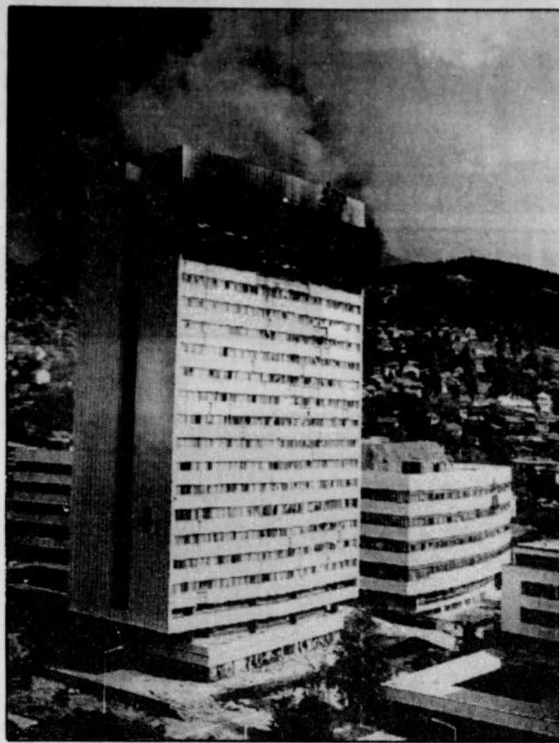
Une fumée épaisse se dégageait hier des étages supérieurs de l'ancien édifice du gouvernement bosniaque, abandonné à la suite de bombardements antérieurs.

Dans leur communiqué, les autorités irakiennes déclarent que les États-Unis, la Grande-Bretagne et la France « tentent, dans le contexte d'un plan colonialiste pernicieux, de créer un second foyer de destruction dans la partie sud du pays (...) dans le cadre d'un complot pour diviser l'Irak, y restaurer le vieux système colonialiste, piller ses richesses et asservir son peuple ».