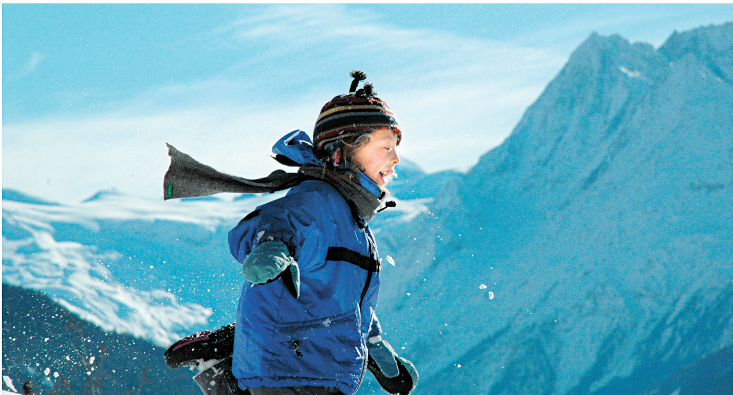
Les escapades dans les splendeurs du canton de Vaud en Suisse, parfois éloquentes sur le profil de « magicienne » de la fillette, forment le cœur de ce film qui n'a aucune ambition pédagogique.