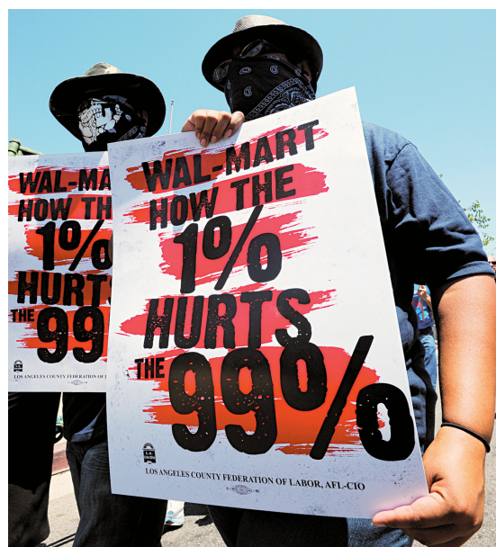
Des manifestations contre Walmart avaient déjà eu lieu en juin, à Los Angeles.