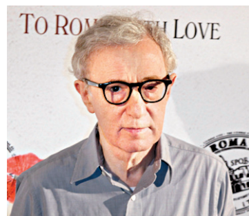
FRANCOIS MORI LA PRESSE CANADIENNE