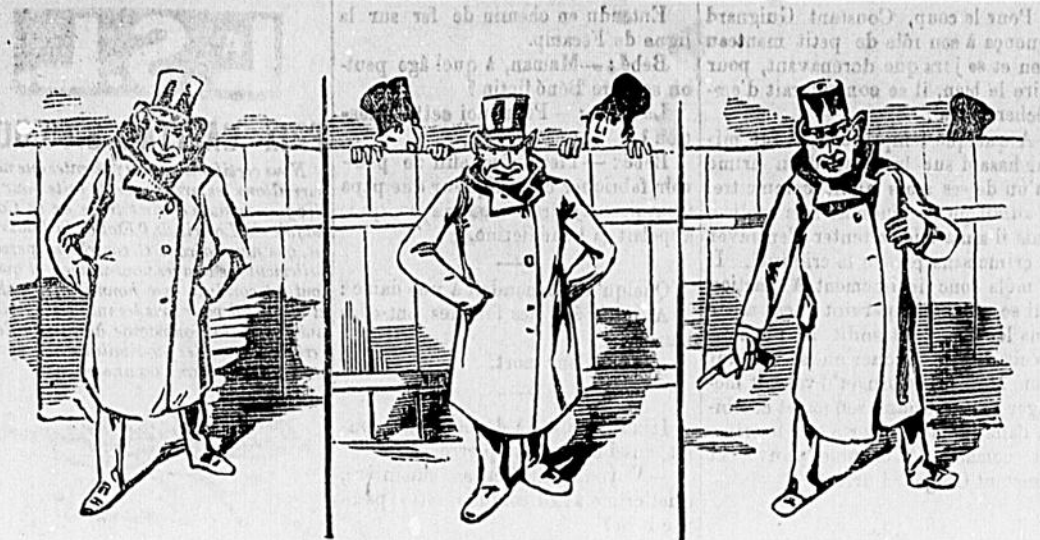
La bourse et la vie

Le maître de Calino lui reprochait d'aller au café. — C'est vrai, Monsieur. Mais c'est un tout petit café, où il n'y a jamais personne !