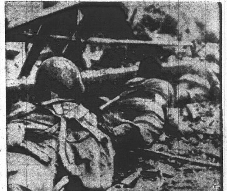
Les fantassins de la 91e armée américaine se tapissent près d'un mur pour éviter d'être atteint par les balles ennemies, dans l'engagement de Julich, en Allemagne. Ce sont ces troupes alliées qui ont traversé la Roer, dans une attaque-surprise.