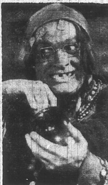
Hugo Haas dans "The Princess and the Pirate" magnifique production technicolore qui met en vedette Bob Hope et qui prendra l'affiche demain au cinéma Impérial.