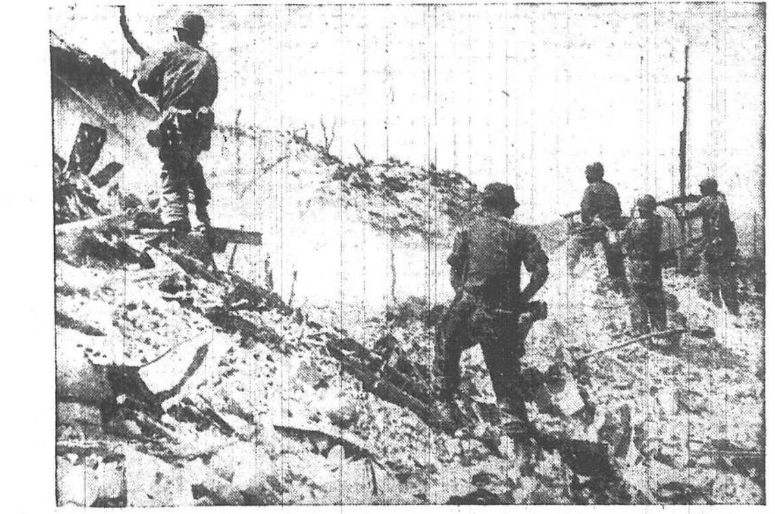
Photo prise lors de l'invasion de l'île d'Iwo Jima par les Américains. On distingue nettement le rivage de l'île en direction duquel un vaisseau d'invasion lance des obus fusées. Les fusiliers-marins américains luttent en ce moment à Iwo Jima la bataille la plus terrible dans l'histoire de ce corps d'armée.

Vargas a émis sa déclaration en faisant connaître qu'une "loi additionnelle à la Constitution" serait ajoutée pour que le système de vote indirect ne retarde pas le but recherché de nos institutions. Cette loi serait en vigueur tant que le président actuel n'aurait pas de successeur.