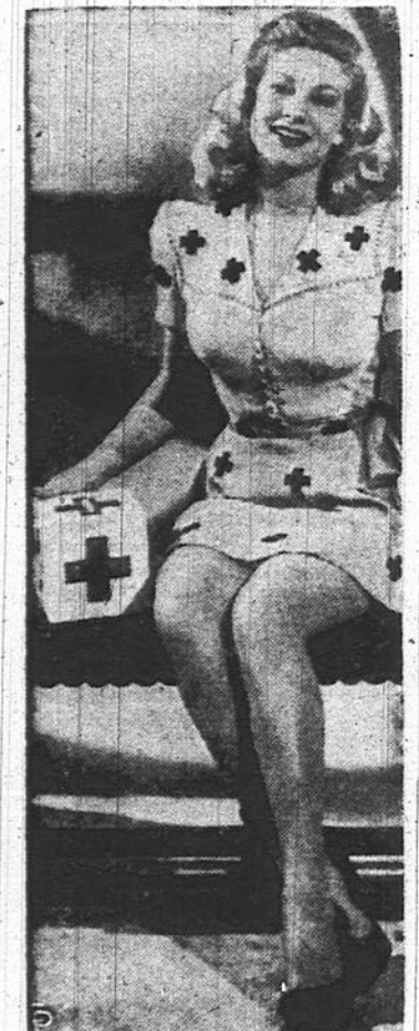
La blonde Chili Williams, jeune étoile de Hollywood, est ici photographiée dans le costume qu'elle portera lors de la tournée des artistes du cinéma en faveur de la campagne de la Croix-Rouge.

Paramaribo, Surinam, 27 (BUP). — Environ 700 employés seront sans emploi dans les mines de bauxite du pays, lorsque la compagnie Billiton cessera ses opérations, temporairement du moins.