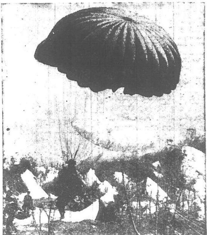
Des parachutistes américains atterrissent sur le sol de Corregidor, à ce moment la infesté de Japonais. Les parachutistes ont pour mission d'assister des manoeuvres amphibies destinées à chasser l'ennemi. Sur cette vignette, les parachutistes prennent l'aspect de champignons géants.

Tête de pont élargie La première armée de la Russie Blanche, conduite par le maréchal Gregory-K. Zhukov, a élargi sa tête-de-pont en face du centre de l'Oder, au sud de Kuestrin, aux approches directes de Berlin par l'est. Entre Kuestrin et Frankfort, un assaut se déroule pour la possession d'une hauteur aux mains des Allemands. Une dépêche de Moscou, entendue par le réseau américain, a révélé que les Nazis ne pourront plus résister de cette façon pendant une longue période, sur le front est.