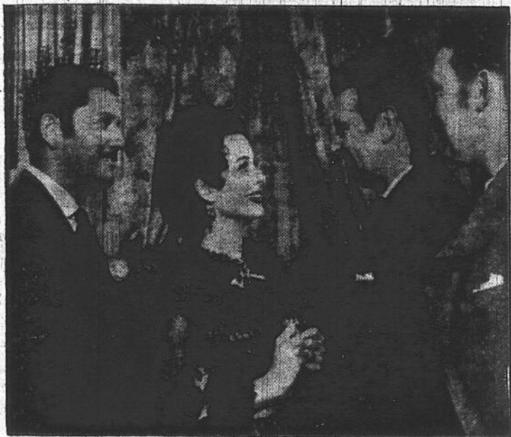
"Experiment Perilous" film mystérieux qui met en vedette trois excellents artistes d'Hollywood soit Hedy Lamarr, George Brent et Paul Lukas. Cette production prend l'affiche demain au cinéma Capitol