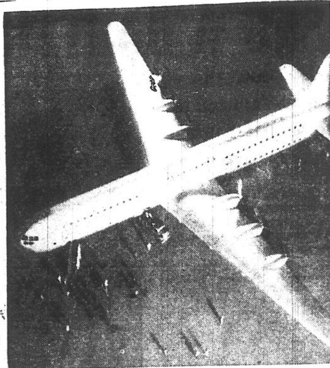
Cette unité de transport la plus gigantesque au monde pourra transporter 204 passagers et 15,000 livres de provisions ou courrier. Cet appareil aérien est douze fois plus gros que le modèle commercial ordinaire. Six engins l'activent, fournissant une puissance égale à 353 automobiles. La longueur de l'avion est de 182 pieds.

Les Allemands prévoyaient sûrement des raids aériens et il aurait été inconcevable qu'ils n'eussent pas songer à mettre leur industrie de guerre à l'abri de ces attaques. Mais malgré cela, malgré toutes ces ruses, l'Allemagne sera bientôt vaincue.