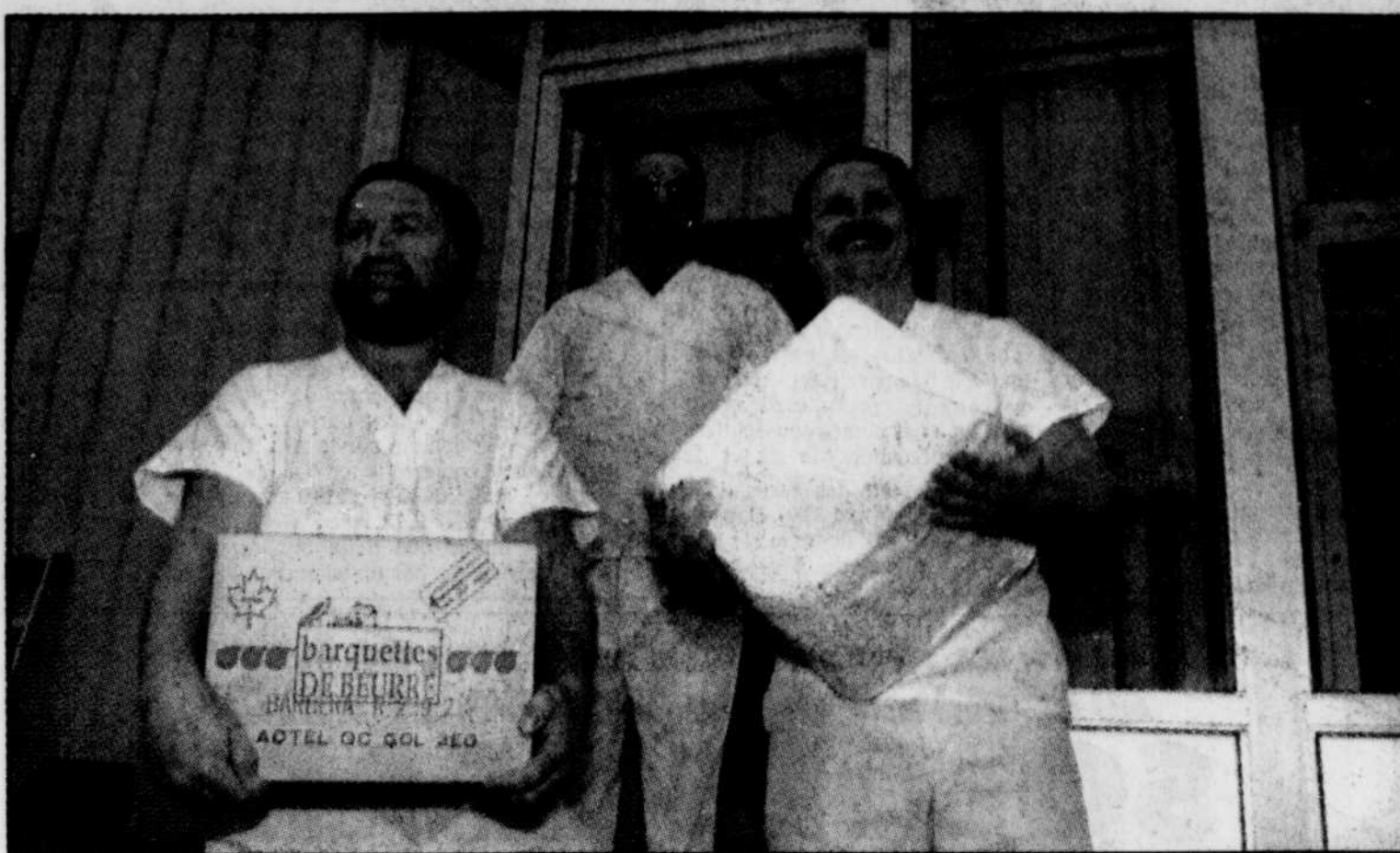
La situation précaire de l'usine laitière de Rivière-Trois-Pistoles, propriété de Lactel, n'empêche pas les employés de garder le sourire.

tière de Rivière-Trois-Pistoles, spécialisée dans la production de beurre et de poudre de lait entier, n'en demeure pas moins critique.