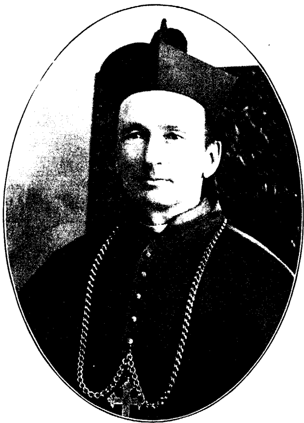
S. G. MGR L.-N. BÉGIN