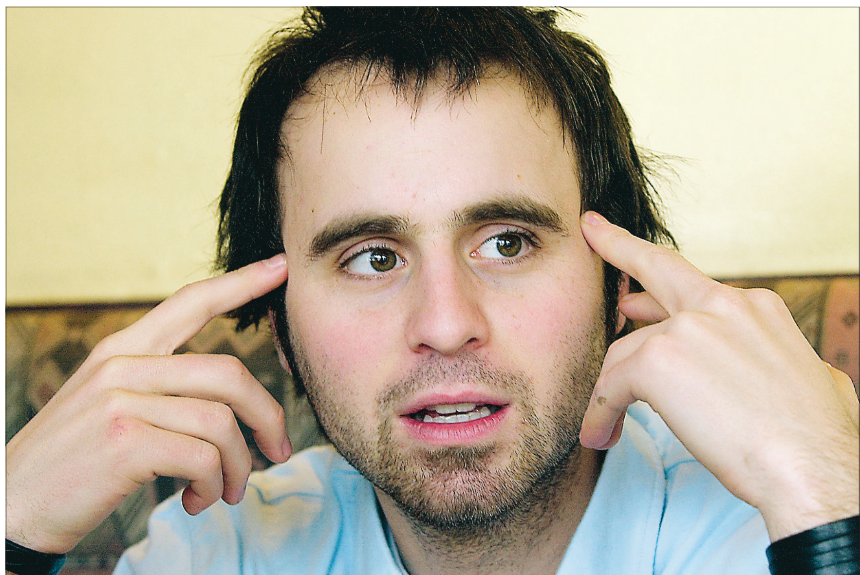
Louis-José Houde est en train d'acquérir une connaissance aiguë des archives télévisuelles

sé Houde a animé Dollaraclip à MusiquePlus, où il présentait les pires vidéos de la station (Pierre Nadeau, D-Natural et le frère de Céline Dion). L'émission a connu beaucoup de succès. Les clips y étaient entrecoupés de courts sketches, dont les chroniques « je rejoins deux gars à Sorel » et les vignettes « vous savez, avec mon travail, je n'ai pas toujours le temps de... ». Dollaraclip joue encore en reprise, mais il n'y aura plus de nouveaux épisodes, la banque de vidéoclips poches étant épuisée.