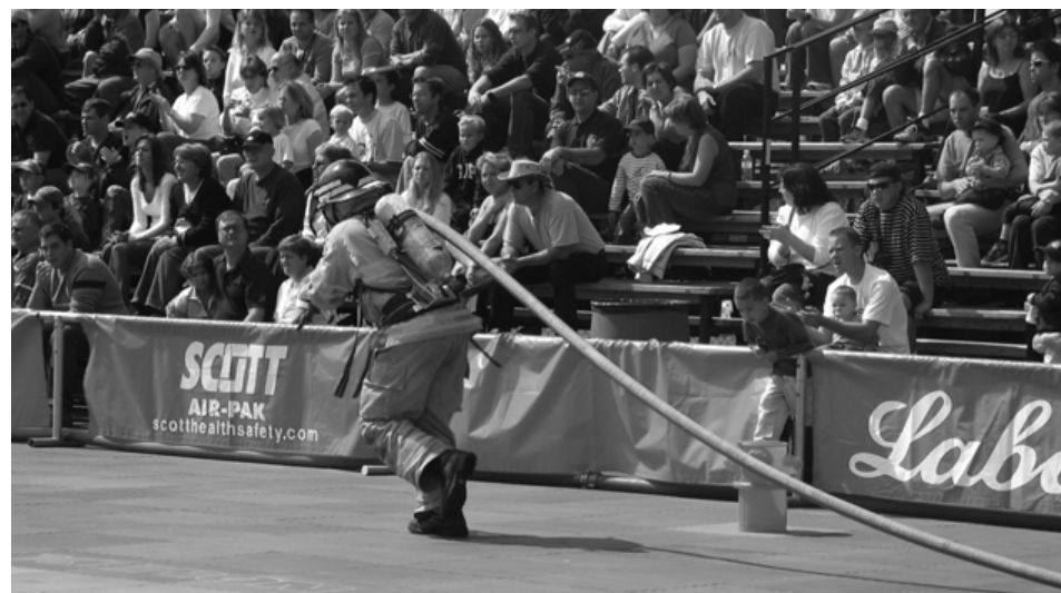
Le Challenge des pompiers de Longueuil suscite beaucoup d'intérêt.

Les festivités, qui se sont échelonnées sur trois jours, comprenaient de nombreux spectacles de percussions offerts par des artistes professionnels ainsi que différentes activités d'animation.