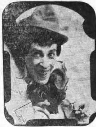
TEXAN, comique excentrique dans le Skidoo Jykello ou le Fils à son poupa