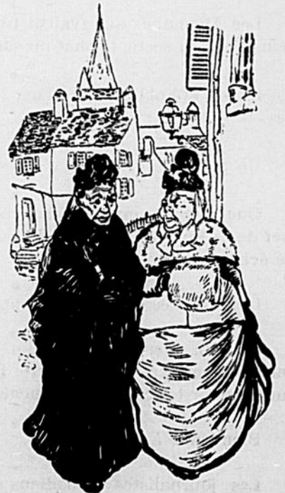
—J'aime la messe de 6 heures. —Oh! oui, nous ne sommes plus de celles qui s'exhibent à la messe de 11½ heures.