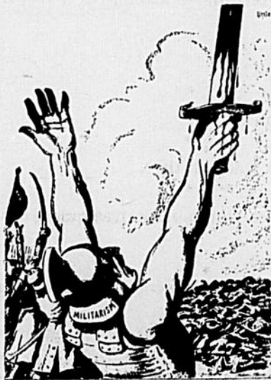
Le Maréchal Foch est en train de le faire disparaître... à jamais.