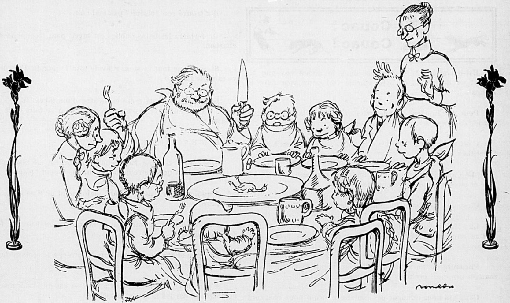
VENTRE AFFAME N'A PAS D'OREILLES... MAIS IL A DES YEUX.