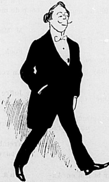
Le monsieur qui jouera les "Madame est servie" dans nos théâtres.