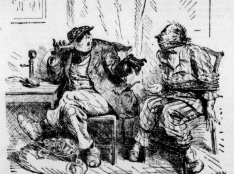
"Non, prenez, prenez, j'aime toujours payer mes propres appels téléphoniques". (Humorist)