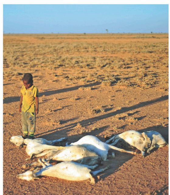
Une période de sécheresse en Somalie, en 2016, a grièvement affecté les troupeaux.

En théorie, les montants globaux doivent atteindre 100 milliards de dollars par année, dès 2020. Mais selon les estimations disponibles, le financement promis ne dépasserait pas, pour le moment, les 67 milliards. Et c'est sans compter les demandes pour les « pertes et dommages » subis par les pays pauvres en raison des impacts des bouleversements climatiques. « Les grands pays ont une responsabilité dans ces dégâts. Ils doivent payer et ils vont le faire », prévient d'ailleurs cette semaine le ministre maro-