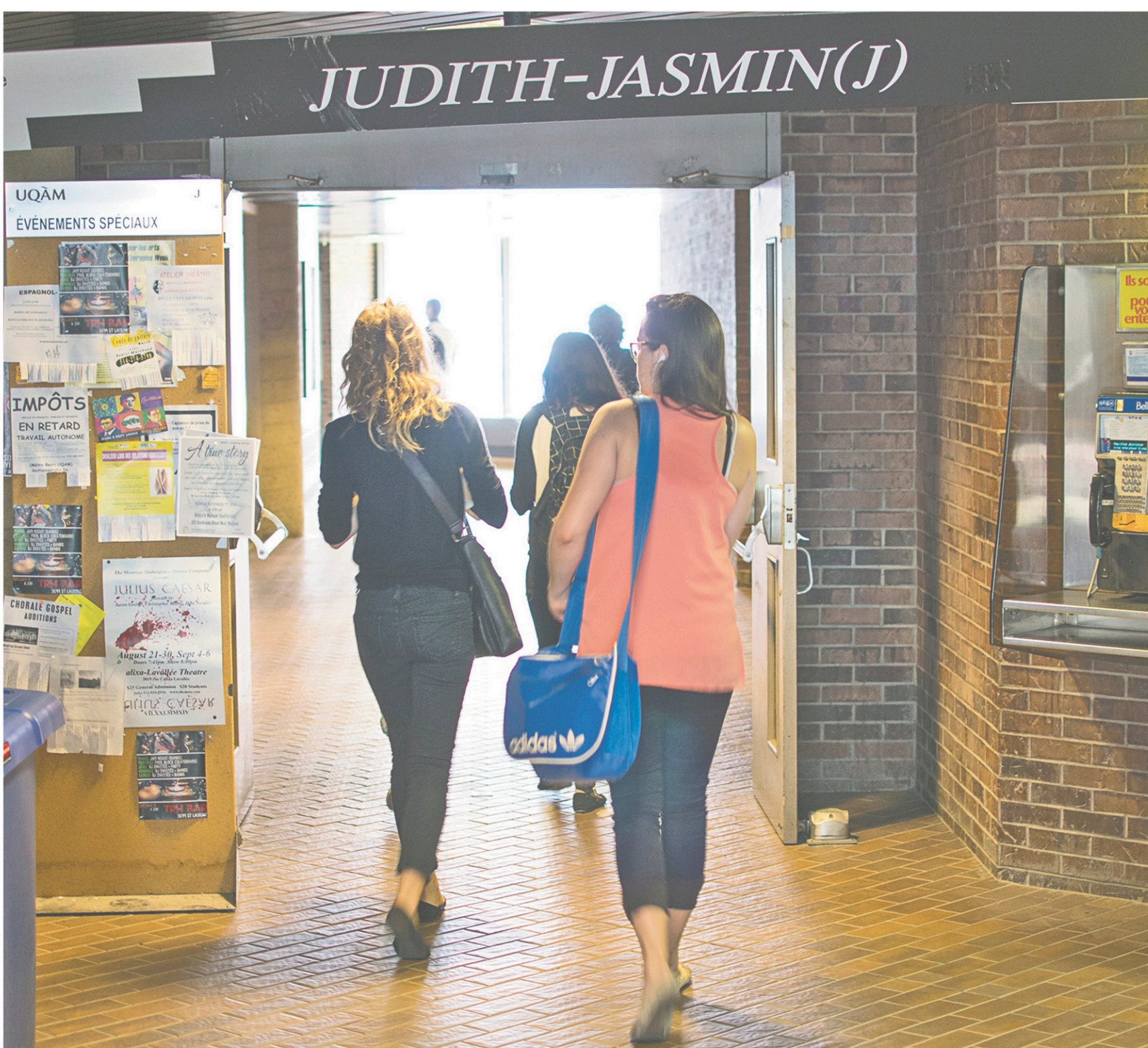
MICHAËL MONNIER LE DEVOIR

La plus vaste enquête jamais menée sur les violences sexuelles dans les universités québécoises — par le Département de sexologie de l'UQAM — a révélé que plus d'une étudiante sur trois est victime d'inconduite sexuelle.