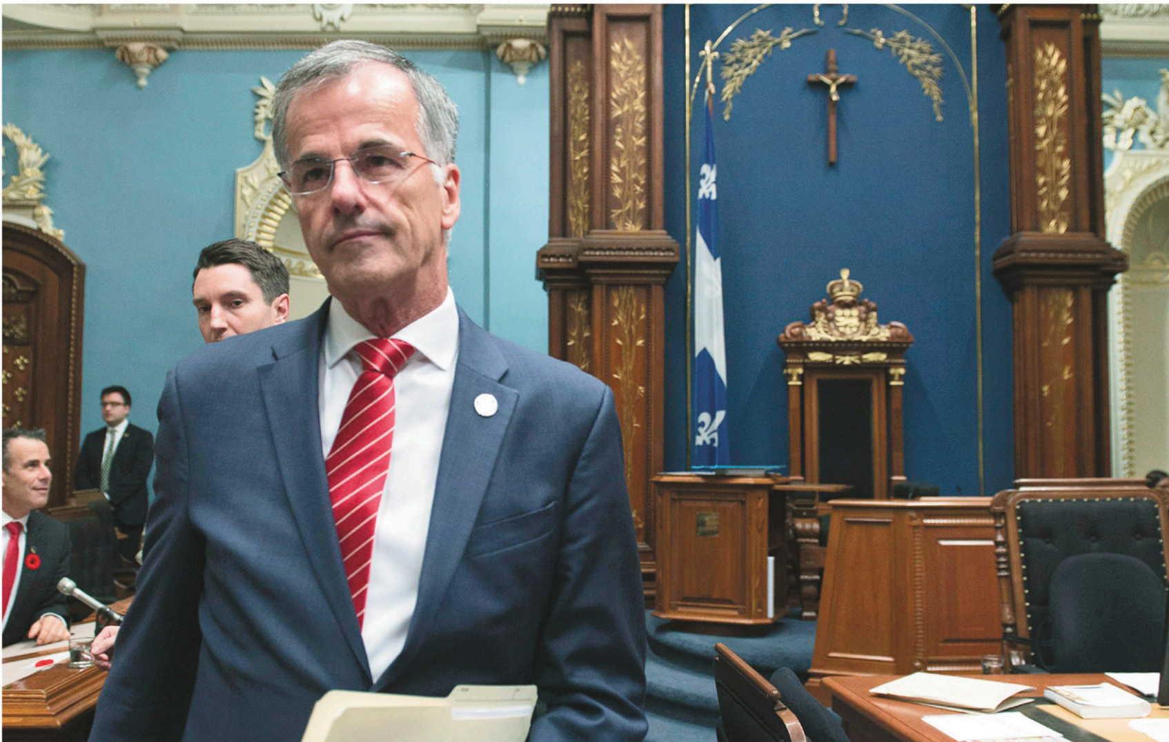
Le député Guy Ouellette, mardi, avant de prononcer une déclaration à l'Assemblée nationale à propos de son arrestation par l'Unité permanente anticorruption (UPAC).

CAHIER B • LE DEVOIR, LES SAMEDI 4 ET DIMANCHE 5 NOVEMBRE 2017