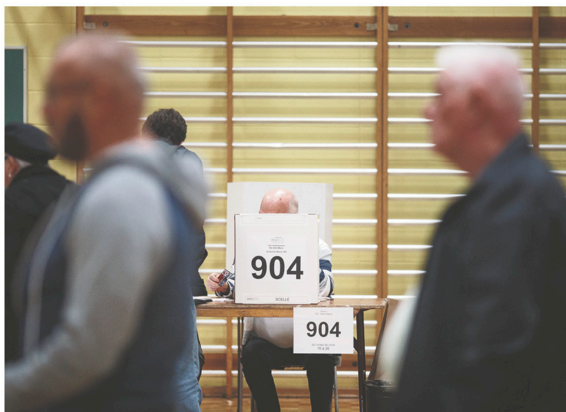
Le taux de participation aux dernières élections de 2013 a été de 47%.

La vitalité de notre démocratie municipale est indispensable. Le projet de loi 122 consacre la municipalité comme gouvernement de proximité, et il a permis de moderniser un dialogue essentiel avec le gouvernement du Québec. Je salue la volonté de ce dernier, qui a enfin reconnu que l'ordre municipal est un acteur incontournable et central du développement local et régional. La municipalité doit disposer des pouvoirs et leviers décisionnels nécessaires afin