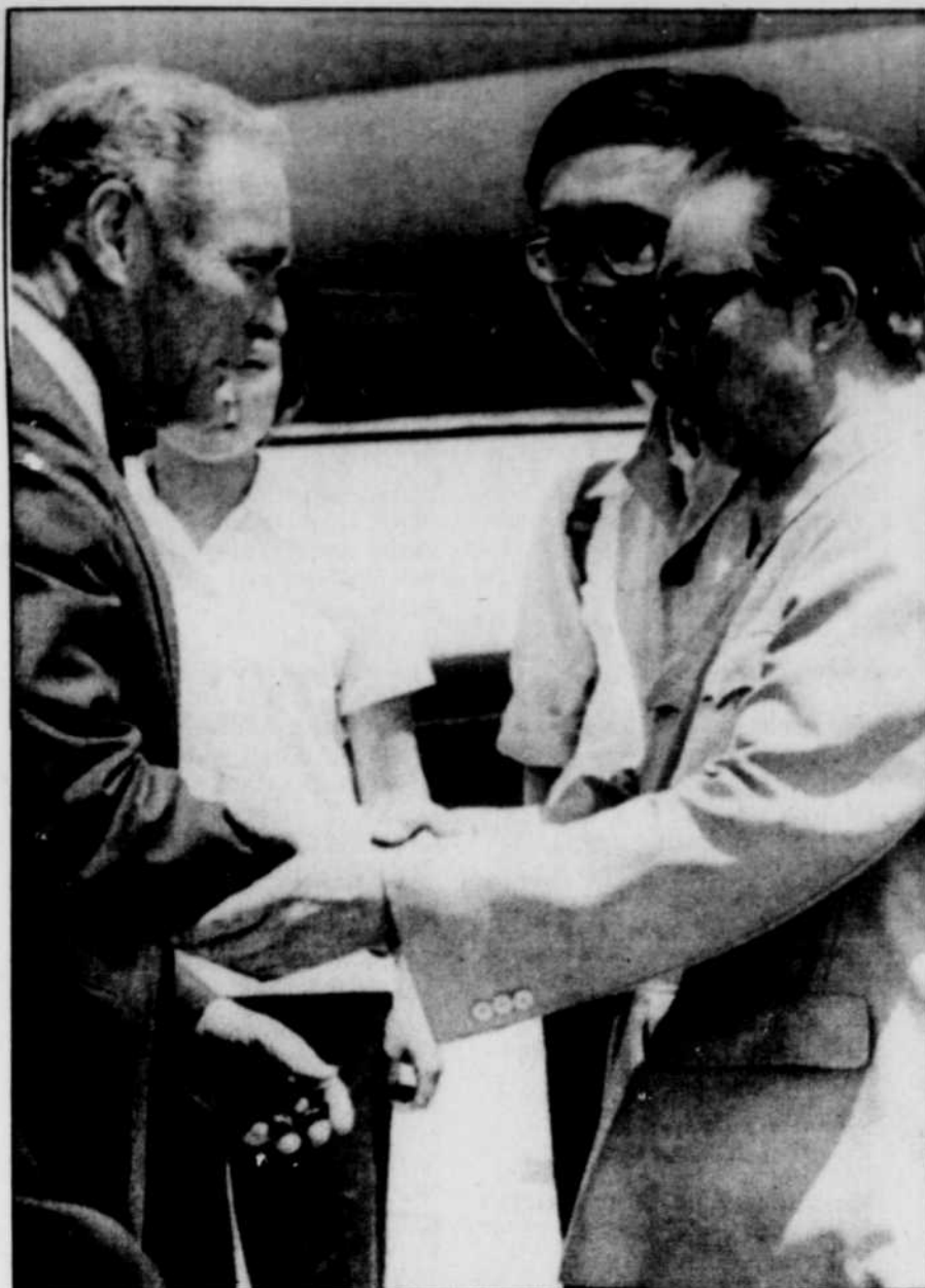
Le secrétaire d'Etat américain Alexander Haig a été accueilli par le ministre des Affaires étrangères chinois, Huang Hua, à son arrivée à Pékin.

Le journal Maariv a affirmé d'autre part dimanche que le secrétaire d'Etat américain Alexander Haig a promis à M. Begin d'empêcher que des sanctions américaines soient prises à l'encontre d'Israël mais à condition que l'Etat hebreu fasse preuve d'une "très grande réserve" dans le domaine militaire.