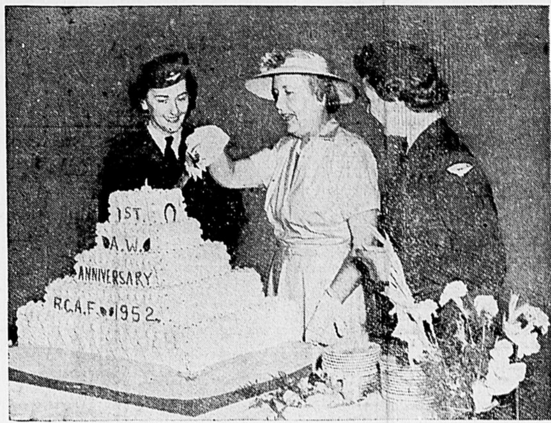
Le premier anniversaire du retour des femmes dans les rangs de la RCAF fut célébré récemment au Dépôt militaire de St-Jean, Québec.