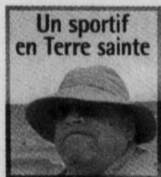
Un sportif en Terre sainte

À l'invitation du Comité Canada-Israël, notre reporter, qui aime emmener le lecteur là où jamais la main de l'humain n'a mis le pied, s'est rendu la semaine dernière assister à des événements sportifs originaux dans ce pays du Proche-Orient. Il amorce aujourd'hui une série de trois textes qui promettent énormément, c'est lui qui vous le dit.