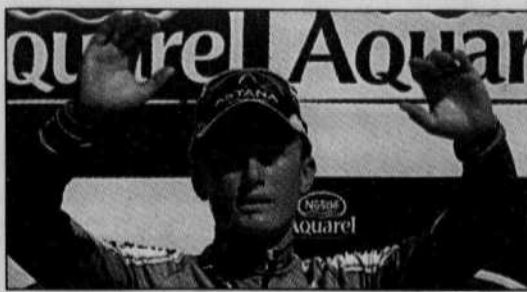
Le Kazakh Alexandre Vinokourov, gagnant des étapes de samedi et de lundi au Tour de France, a été convaincu de dopage hier.