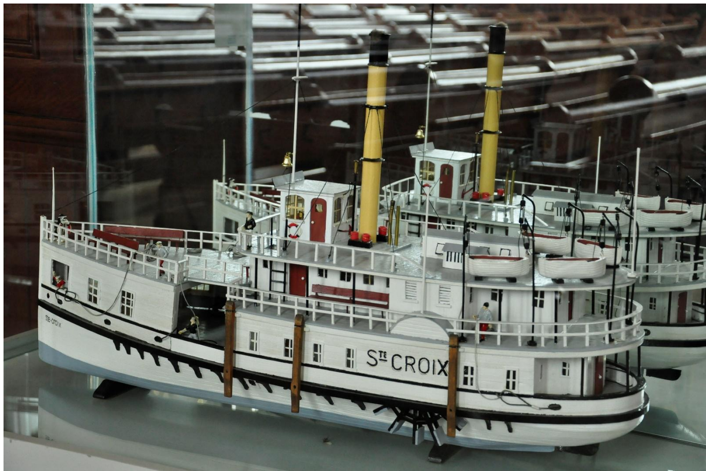
La maquette située dans l'église de Sainte-Croix.

La municipalité de Sainte-Croix comptera deux maquettes représentant ce caboteur; témoin de son riche passé maritime. L'une d'elles fait partie de la municipalité depuis plusieurs années et est exposée dans la nef de l'église sous la tribune du transept ouest. La nouvelle acquisition, la maquette d'Alfred Baron, sera exposée dans l'Hôtel de Ville à partir du 27 avril 2016.