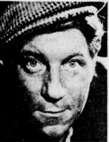
A Radio-Québec, un classique avec Jean GABIN.

Enfin, à 22h, le réseau CTV (canal 12) présente DIONNE WARWICK IN CONCERT.