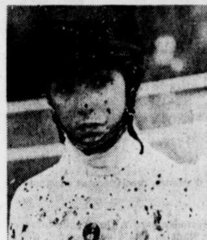
Tatum O'Neal fait une Sarah pas trop "mélo".

"Sarah" ne vise pas a priori l'effet lacrymatoire. Tatum O'Neal s'affirme plutôt comme une véritable actrice que comme la mignonne adolescente qui veut faire soupir les mères. C'est du cinéma de consommation, propre, racé, divertissant, plein d'émotions en