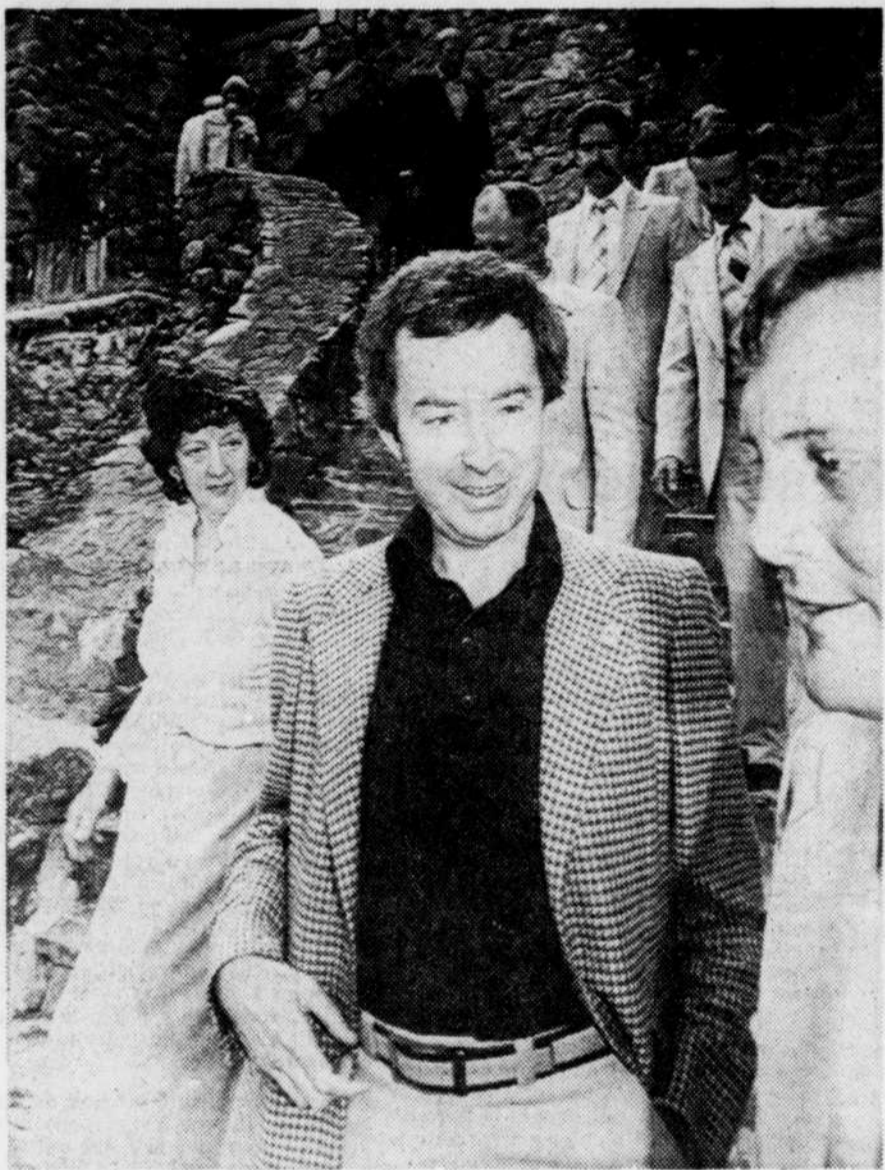
M. Clark et sa suite descendent du magnifique chalet du lac Meach, propriété du gouvernement fédéral. C'est là qu'a eu lieu la réunion de 26 des 29 ministres conservateurs, hier.

Le débat doit se poursuivre jusqu'à minuit ce soir, et peut-être la semaine prochaine. Le gouvernement a en effet l'intention d'obtenir au moins l'adoption de la deuxième lecture, devant l'impossibilité physique de franchir toutes les étapes sans imposer le baillon, ce que le ministre Léonard refuse comme contraire à l'esprit même de son projet.