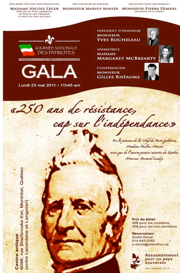
Fig. 1. Publicité du Gala RPS 2011 parue entre autres dans Le Devoir p.A3, (jeudi 19) mai 2011. Diner_GALA_2011_.jpg