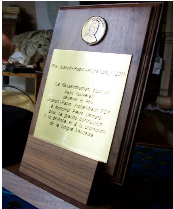
Fig. 4. Prix Joseph-Papin-Archambault 2011, Pierre Demers. PlaquePrix28.png