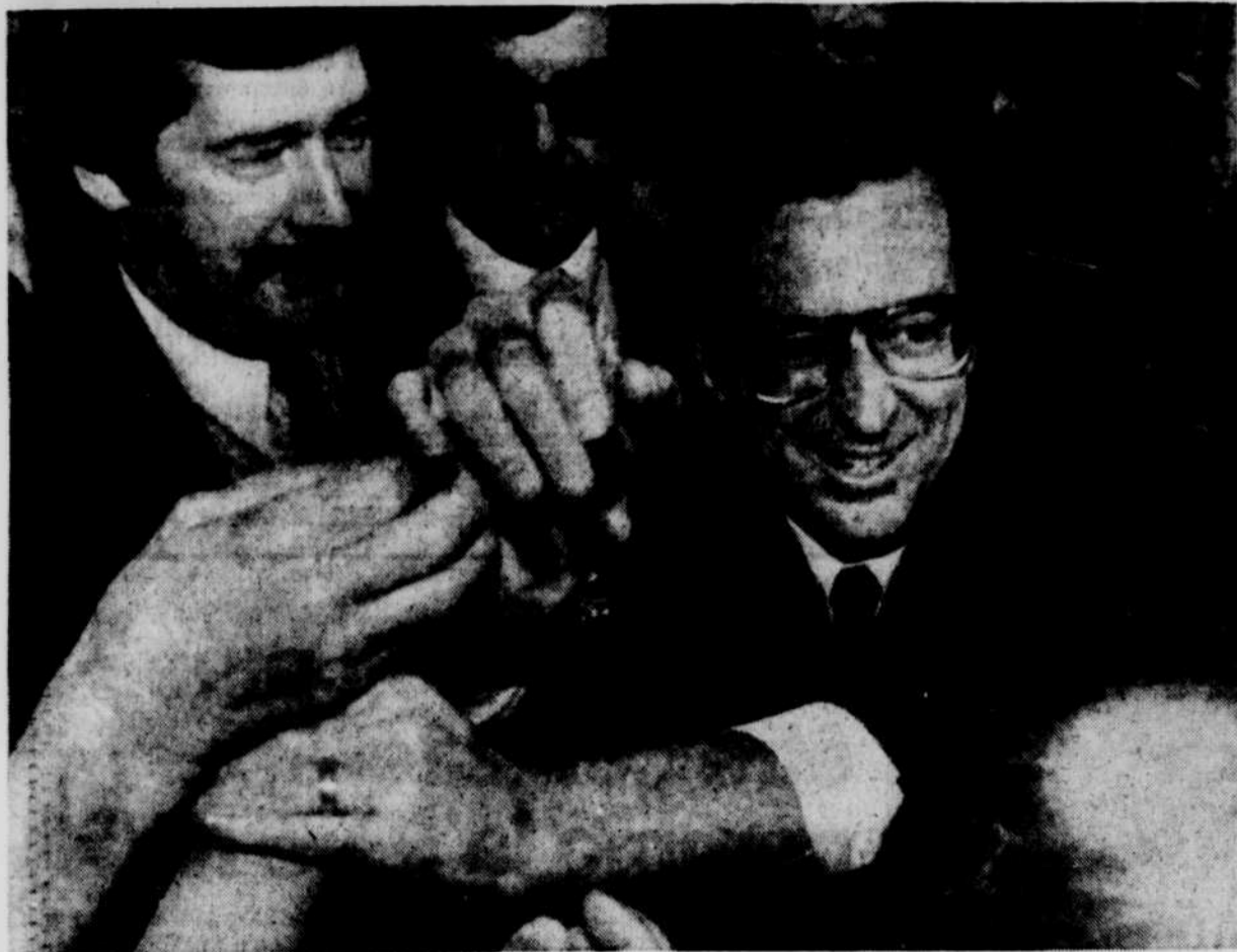
Des partisans libéraux tentent de donner la main au chef libéral Robert Bourassa. La scène se déroulait au rassemblement tenu à l'université Laval, samedi soir.