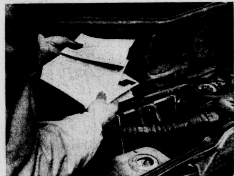
Le Soleil, Jean Vallières