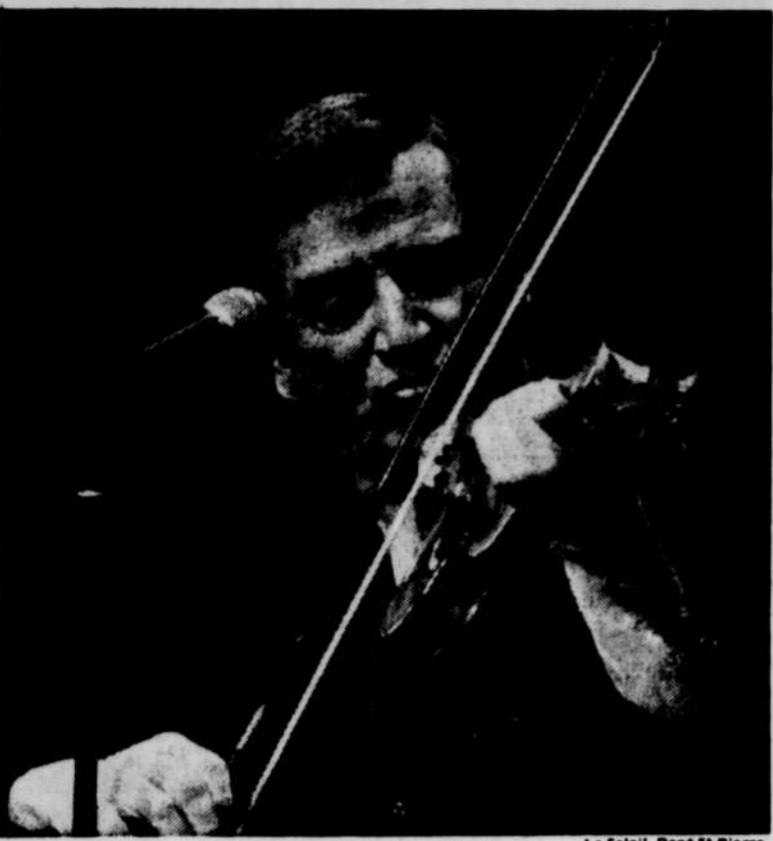
Ceux qui ont besoin d'un implant cochléaire, a dit Jean Lapointe, au cours de son spectacle, ce sont ceux qui sont coq-l'oeil, mais dans l'oreille...

◆ Quelques 1,200 personnes ont déboursé hier soir $50 chacune pour assister à la représentation spéciale du spectacle de Jean Lapointe, à la salle Louis-Frédéric du Grand Théâtre.