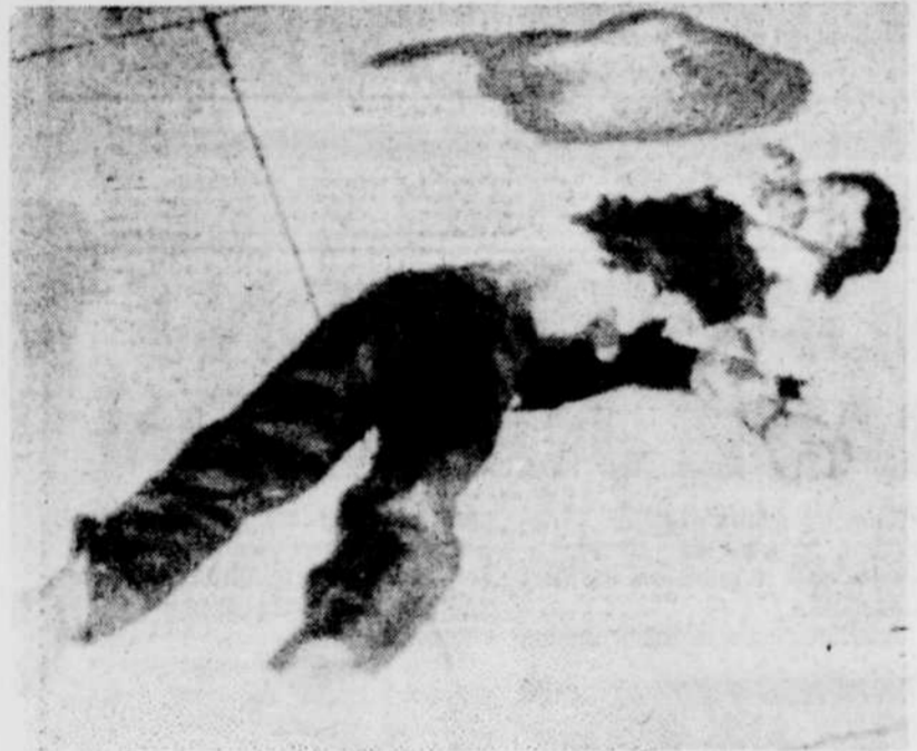
Quelques instants après le tragique assaut, le corps de l'un des pirates de l'air gît inanimé sur le sol. Les cinq auteurs du détournement ont trouvé la mort dans l'attaque de l'avion.