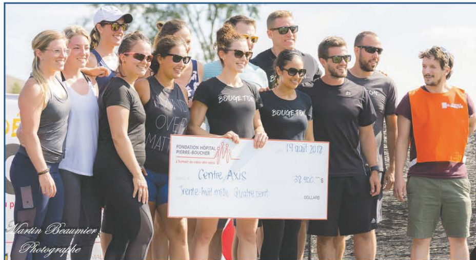
Au terme de la journée, les organisateurs du Défi Axis ont indiqué que le bénéfice net amassé s'élevait à 38 400 $.