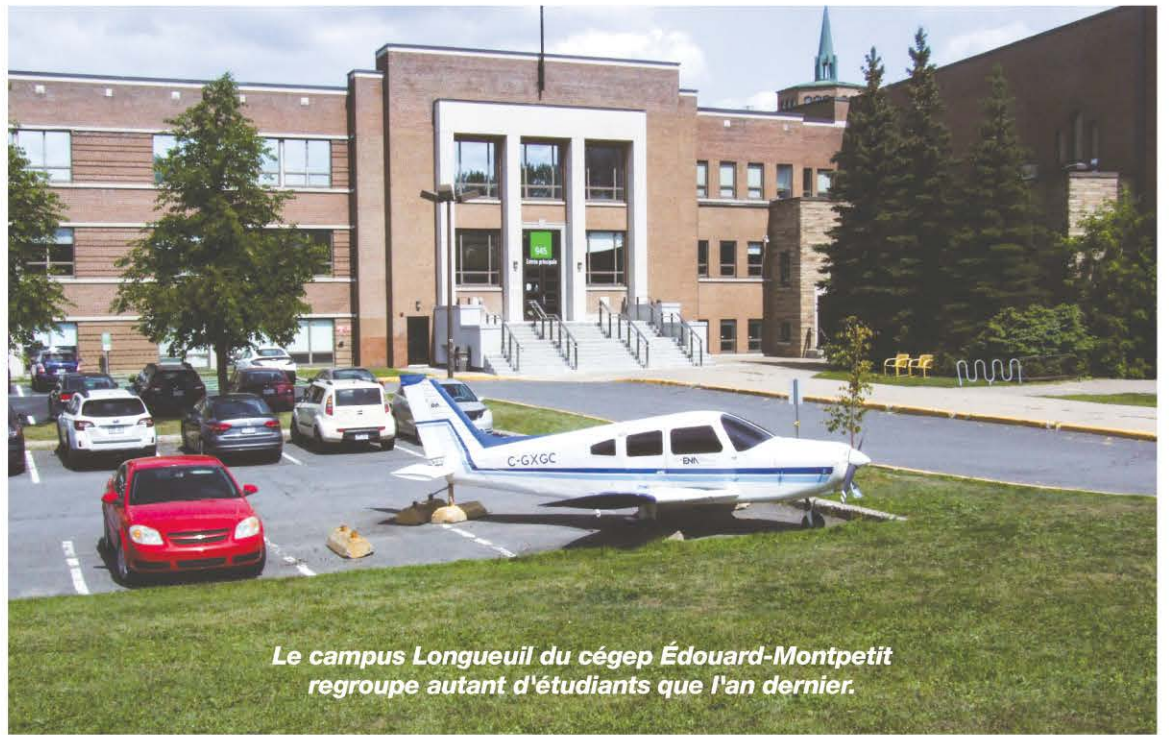
Le campus Longueuil du cégep Édouard-Montpetit regroupe autant d'étudiants que l'an dernier.

Sur le plan sportif, le cégep met en place cet automne une nouvelle équipe Lynx E-sport. Devant la popularité des jeux vidéos, les membres de cette équipe auront le loisir de jouer