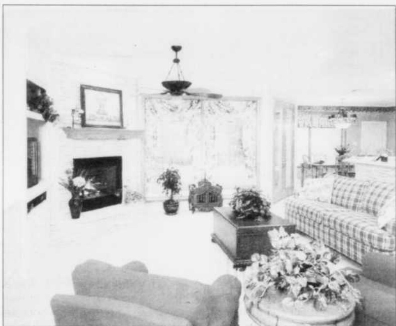
FENÊTRES - Les gens ne savent pas à quel point le rajeunissement et l'amélioration des revêtements pour fenêtres peut changer l'aspect du décor intérieur.

• Les stores verticaux offrent également une excellente maîtrise de la luminosité et de l'intimité mais conviennent mieux