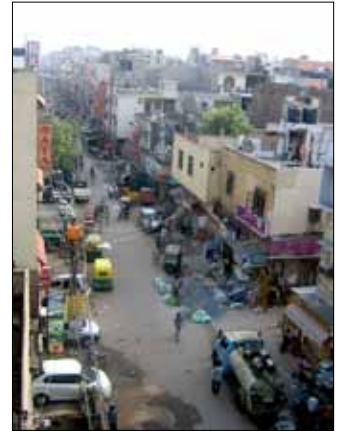
New Delhi, Main bazar street

Julie Martineau, pour les professeurs de science politique