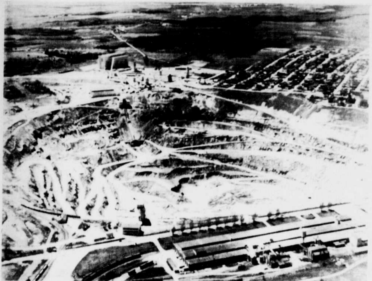
Même si les mines d'amiante de l'Estrie ont été fermées pendant la moitié de l'année, des dizaines de milliers de tonnes de fibre invendues dorment dans les entrepôts des sociétés

cinq semaines et que quelque 80 travailleurs ont été licenciés. La seule compagnie minière d'amiante à ne pas avoir encore effectué de mise à pied est Lac d'Amiante du Québec. En 1982, la LAQ a fermé sa division de Black-Lake pour sept semaines en comparaison de onze pour la division National.