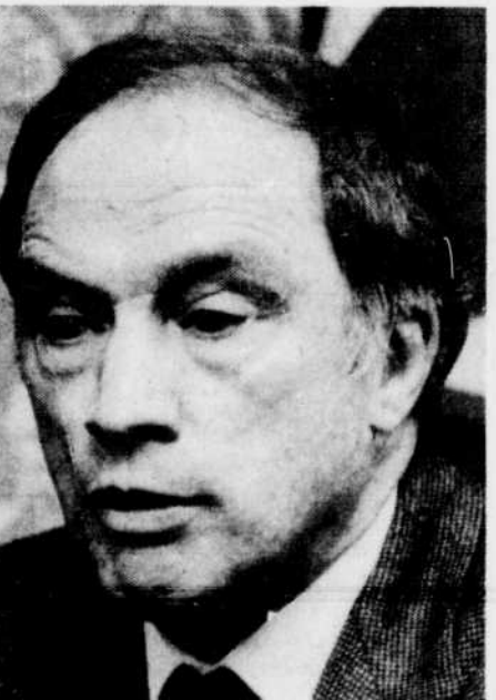
Pierre Elliott Trudeau

De même, lorsqu'en 1981 le Québec s'est présenté devant la Cour suprême en compagnie des autres provinces