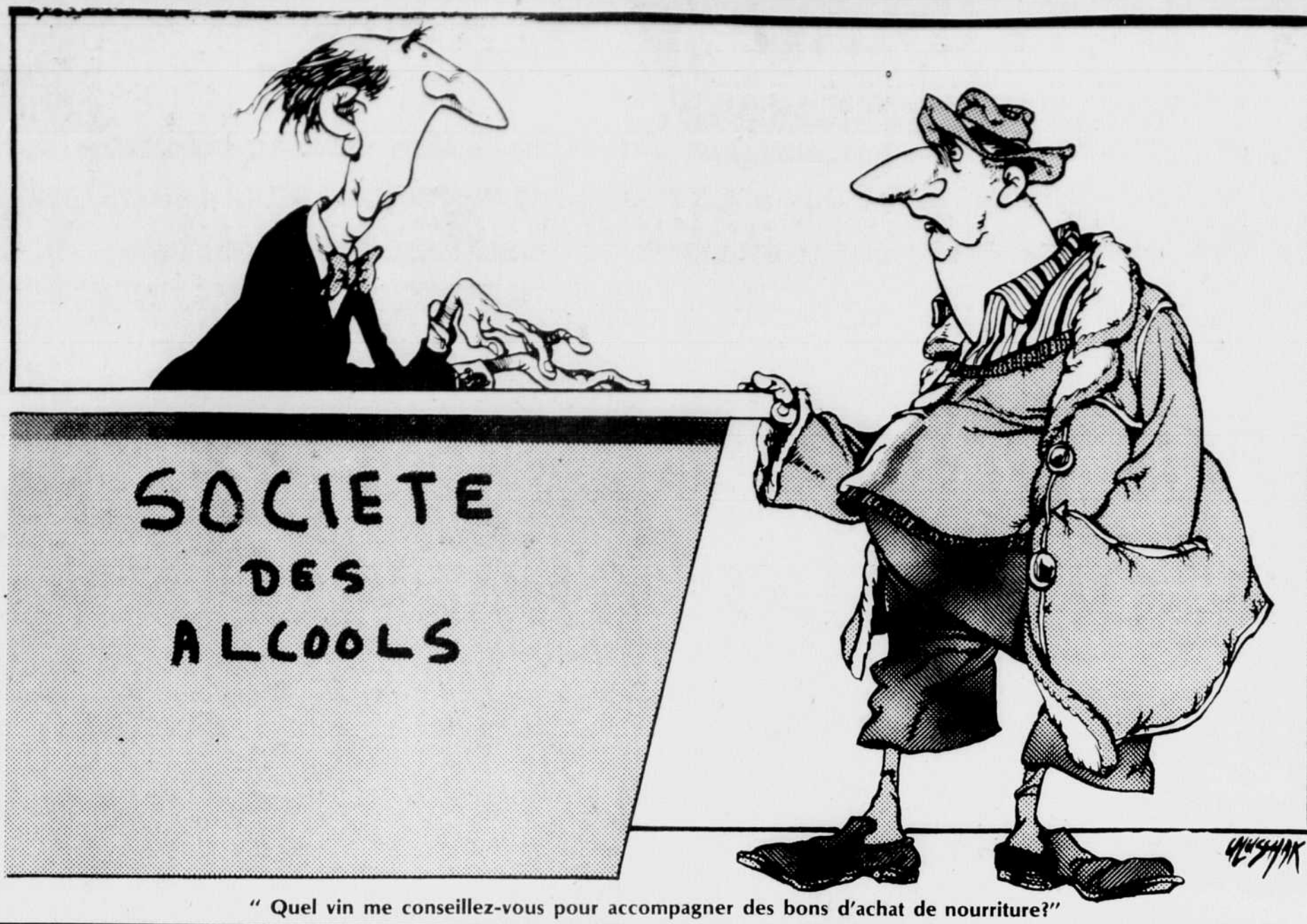
" Quel vin me conseillez-vous pour accompagner des bons d'achat de nourriture?"

M. Lévesque n'appréciera guère la réponse de M. Trudeau. Pourtant c'est la seule issue possible dans ce dossier même s'il enferme le gouvernement péquiste dans un dilemme dont même la casuistique étriquée de Jacques-Yvan Morin ne le sortira pas. Comment un gouvernement né d'une volonté de faire l'indépendance peut-il accepter le principe de la Constitution canadienne sans renier ses objectifs de départ? A l'inverse, comment un gouvernement dont la majorité des électeurs a dit NON au référendum peut-il continuer à boudier le fédéralisme tout en gardant sa légitimité? Pourquoi le Québec obtiendrait-il un droit de veto sur une Constitution à laquelle il prétend échapper à jamais?