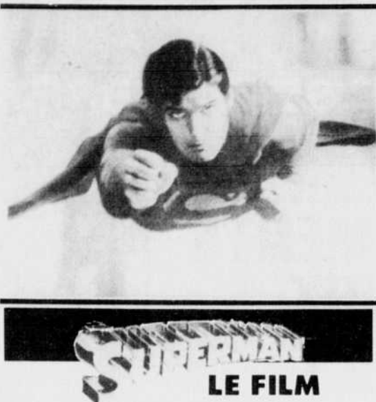
SUPERMAN LE FILM

Prévoyant la destruction imminente de sa planète, un savant de Krypton met son jeune fils dans une fusée spatiale qu'il oriente vers la Terre. L'enfant est recueilli et élevé par un fermier du Kansas. Doté de pouvoirs surhumains, il se lance, à l'âge adulte, dans la lutte contre le crime tout en poursuivant une carrière de journaliste, dans une grande ville, sous l'identité d'un reporter pusillanime, Clark Kent. Il empêche un génie criminel, Lex Luthor, de détruire la côte du Pacifique par un séisme. Drame de science-fiction, 2h23.