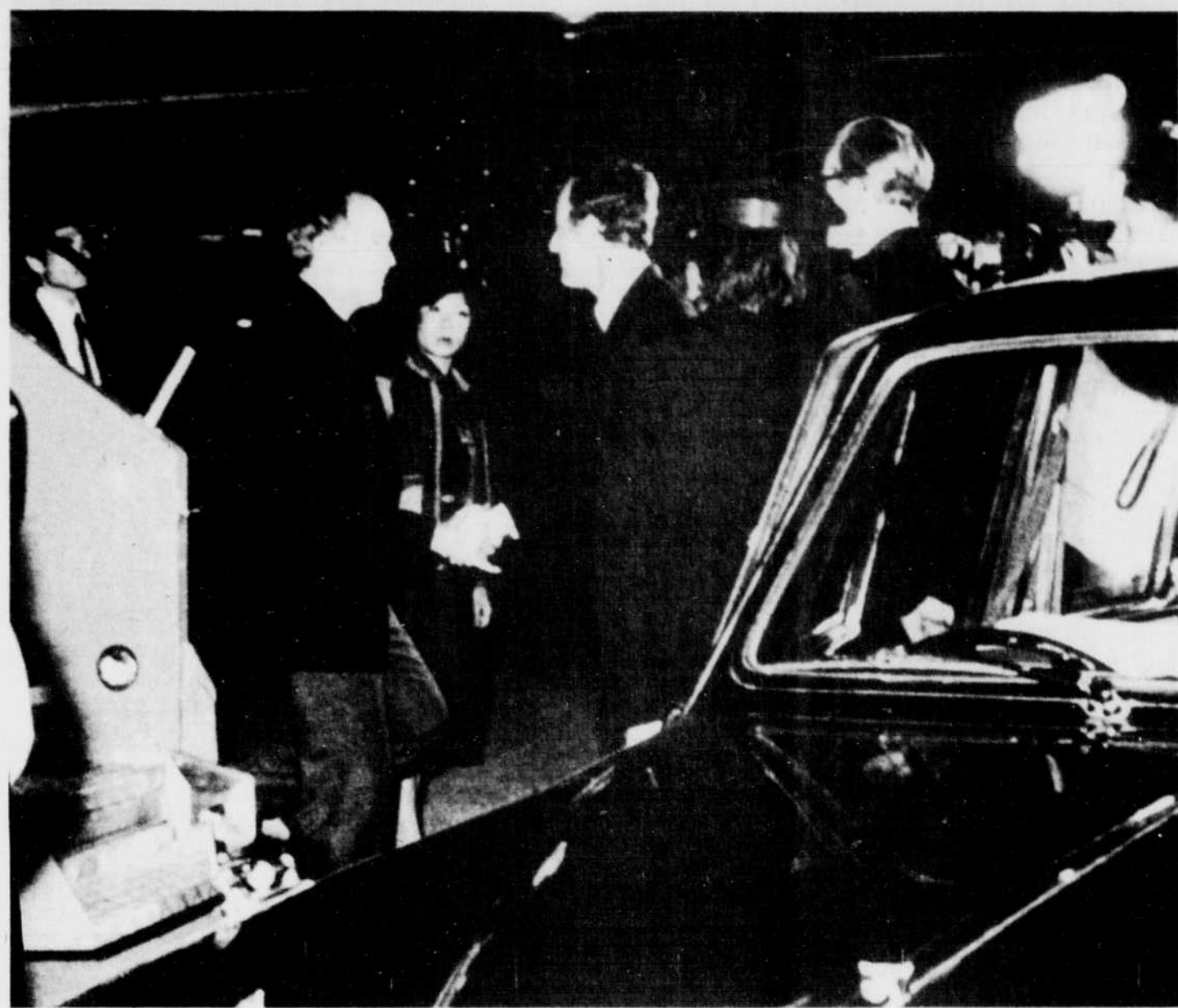
HONG KONG (PC) — Accompagné de son fils Sacha, le premier ministre Trudeau est arrivé à Hong Kong, lundi soir, faisant une première étape dans son voyage en Asie.

"Nos exportations de technologie, par exemple, constituent moins de un