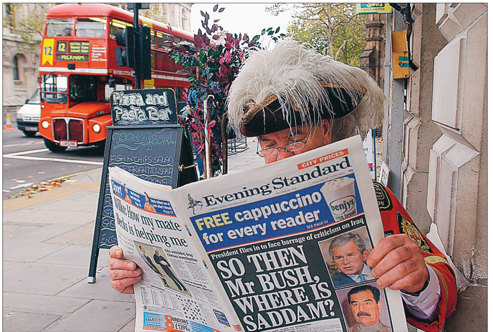
Un crieur public prend quelques instants à Londres pour lire un journal qui interpelle George W. Bush sur le sort de l'ex-dictateur irakien, Saddam Hussein. Le président américain est arrivé hier soir dans la capitale anglaise pour un séjour officiel de quatre jours qui doit être ponctué par de multiples manifestations. Voir nos informations en page 2.