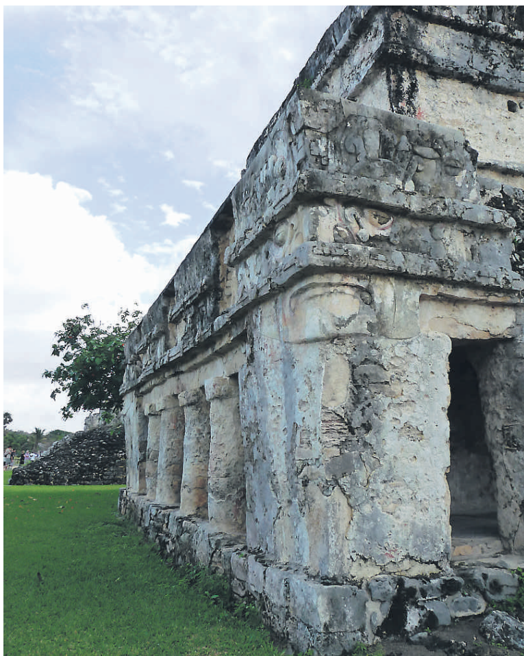
Sur le site archéologique maya de Tulum

Xel-Hà, Xcaret et Xplor (exploration de rivières et de grottes).