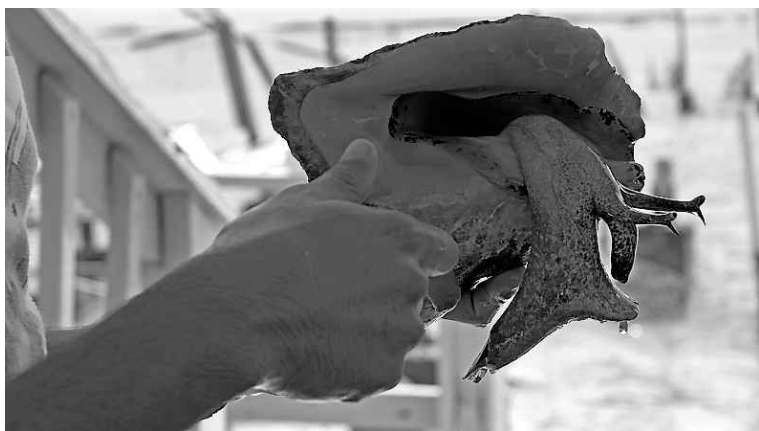
La conque, une spécialité des îles

Puis, dans le petit village de Kew, c'est dans une salle à manger sobrement décorée de souvenirs de la Guyane et d'images saintes qu'une résidente de