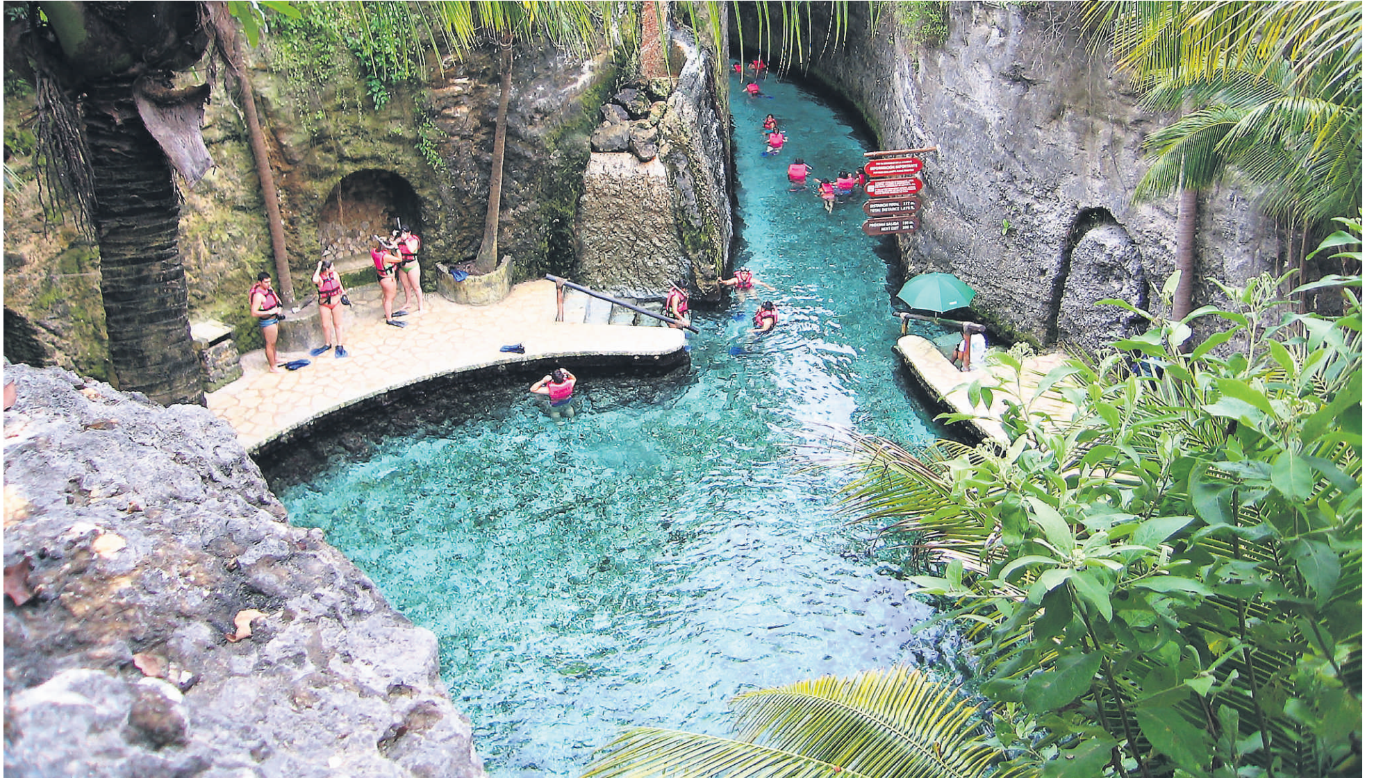
Plongée en apnée dans le parc Xcaret