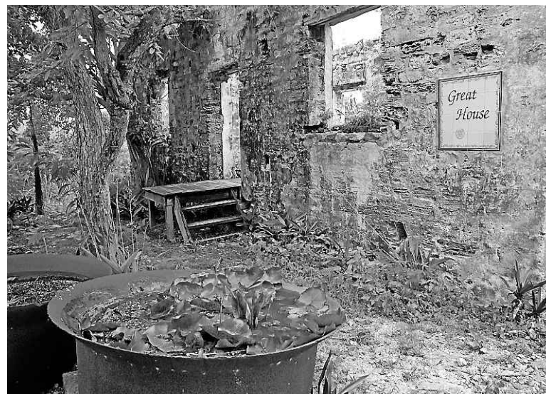
La plantation de coton de Wade

Peu de choses poussent sur le sol aride des Turquoises. Le tourisme, qui a vraisemblablement pris son élan dans les années 80 avec l'arrivée d'un Club