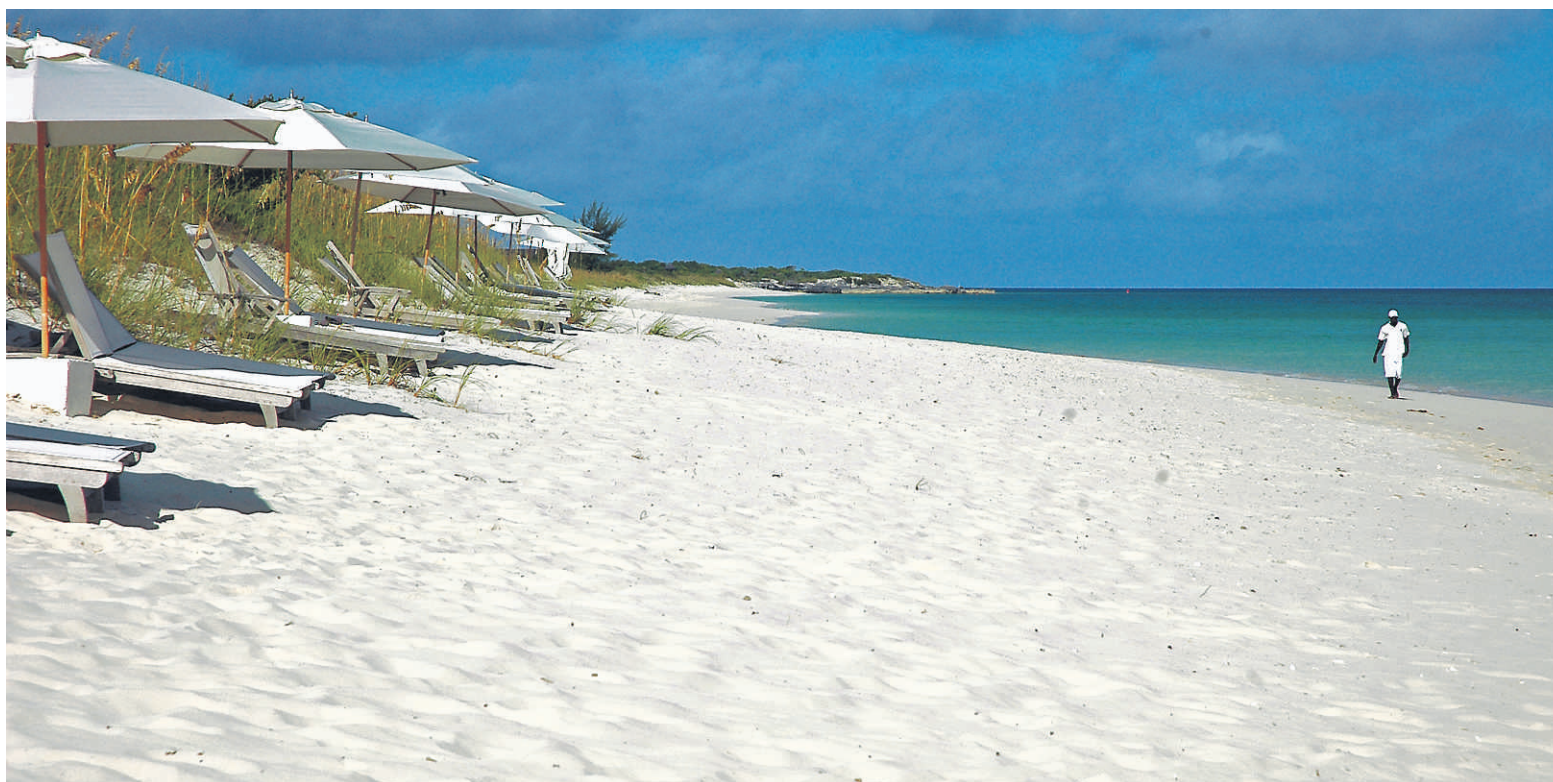
La plage du Como Shambhala, à Parrot Cay

Puis, si comme nous, vous vous trouvez dans ces îles le quatrième ou le cinquième jour suivant la pleine lune, embarquez-vous à la brunante à bord d'un bateau pour voir les vers luisants. En s'accouplant à la surface des eaux peu profondes de la mer une fois par mois, ces vers brillent comme des lucioles dans la nuit.