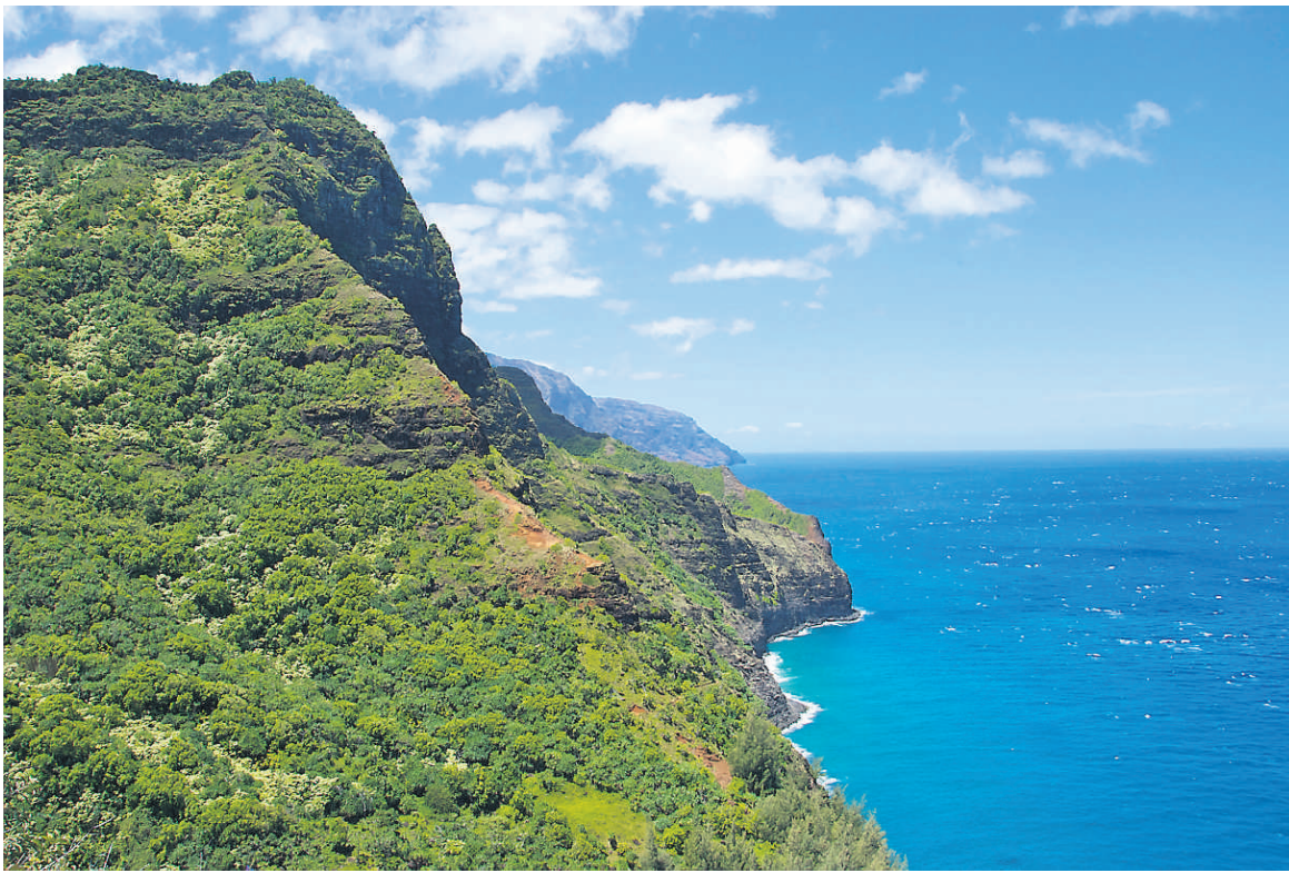
La côte Na Pali doit sa renommée aux falaises vertigineuses qui se dressent en un mur imposant de roche volcanique et d'une végétation abondante, sur toute une partie de la côte nord de l'île de Kauai, à Hawaii.