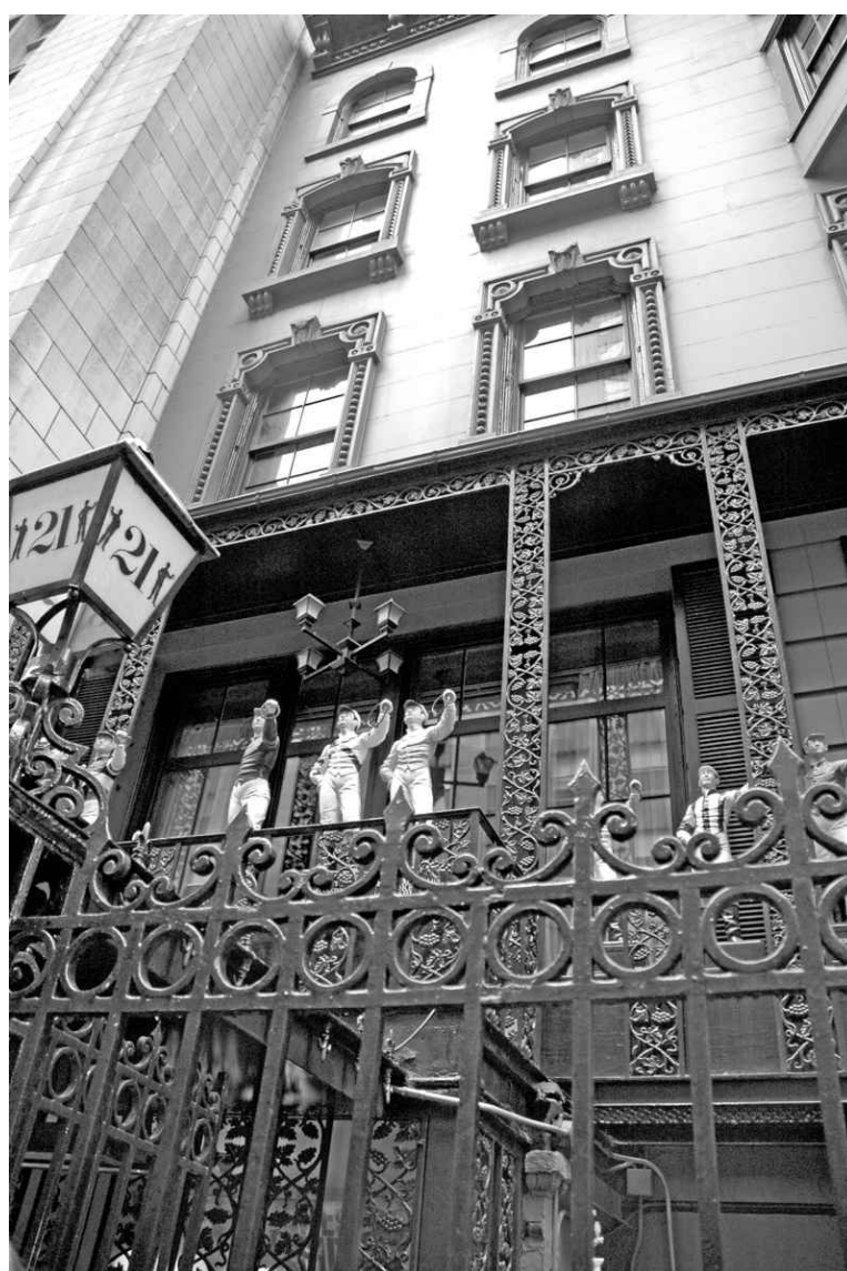
La façade du 21 Club

Le choix est difficile. La liste est impressionnante! De la Louisiane date de 1896 alors que le Ritz Champagne offre un mélange de cognac Martell Cordon Bleu et de champagne Moët & Chandon Impérial agrémenté d'un cube de sucre trempé dans de l'Angostura... Heureuse renaissance!