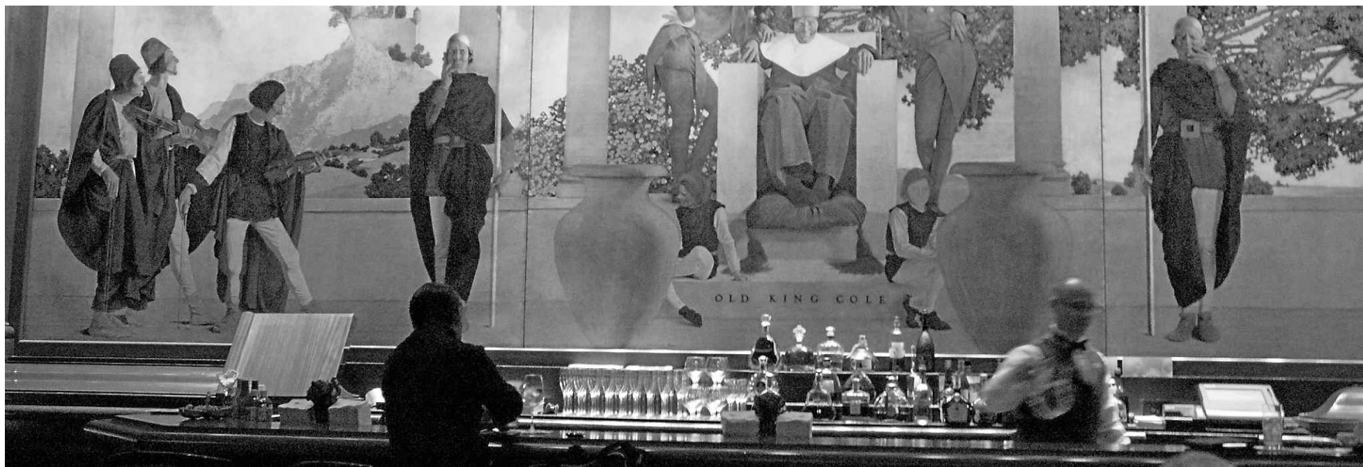
Le bar King Cole situé dans le St. Regis Hotel