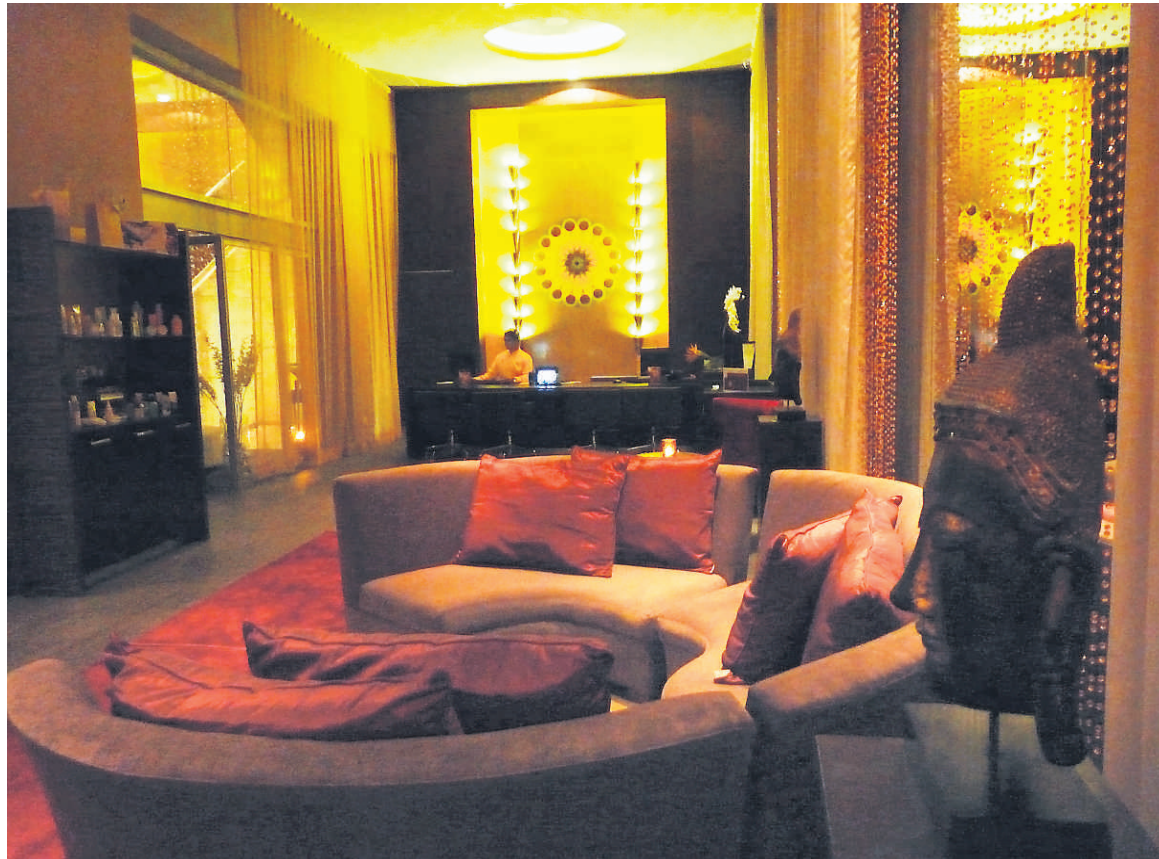
Ambiance feutrée au Spa YHI de Paradisus à Playa del Carmen — PHOTOS COLLABORATION SPÉCIALE ANNE PÉLOUAS

La journée typique de l'hyperactif au tout nouveau Paradisus de Playa del Carmen (ouvert en novembre dernier) commence par quelques longueurs de piscine ou en mer avant d'aller prendre un solide petit déjeuner. À 9h, on est fin prêt pour une séance de stretching ou de yoga, suivie d'un cours d'aquaforme le midi. En après-midi, notre vacancier apprendra comment bien faire un vrai guacamole ou des sushis, à moins qu'il ne parte en bateau pour se rendre au plus près de la barrière de corail où il plongera