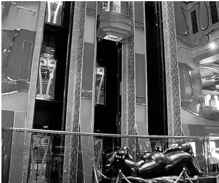
Tout n'est que luxe et scintillement à l'intérieur du paquebot.