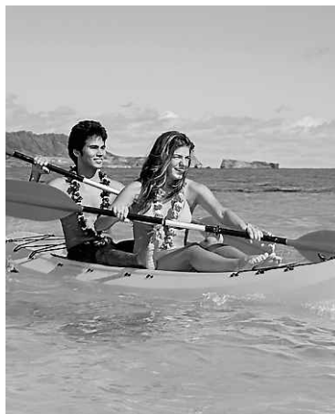
Un jeune couple en kayak à Hawaï.

sort la tête de l'eau... Et tandis qu'on s'approche de la plage, vers 16h, on se dit que finalement, c'était loin d'être aussi difficile qu'on nous l'avait laissé croire.