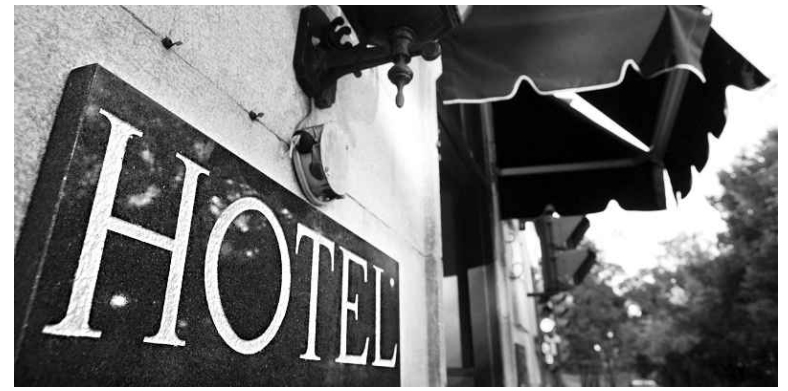
Il y aurait environ 300 hébergements illégaux dans la grande région de Québec selon l'Association hôtelière de Québec.