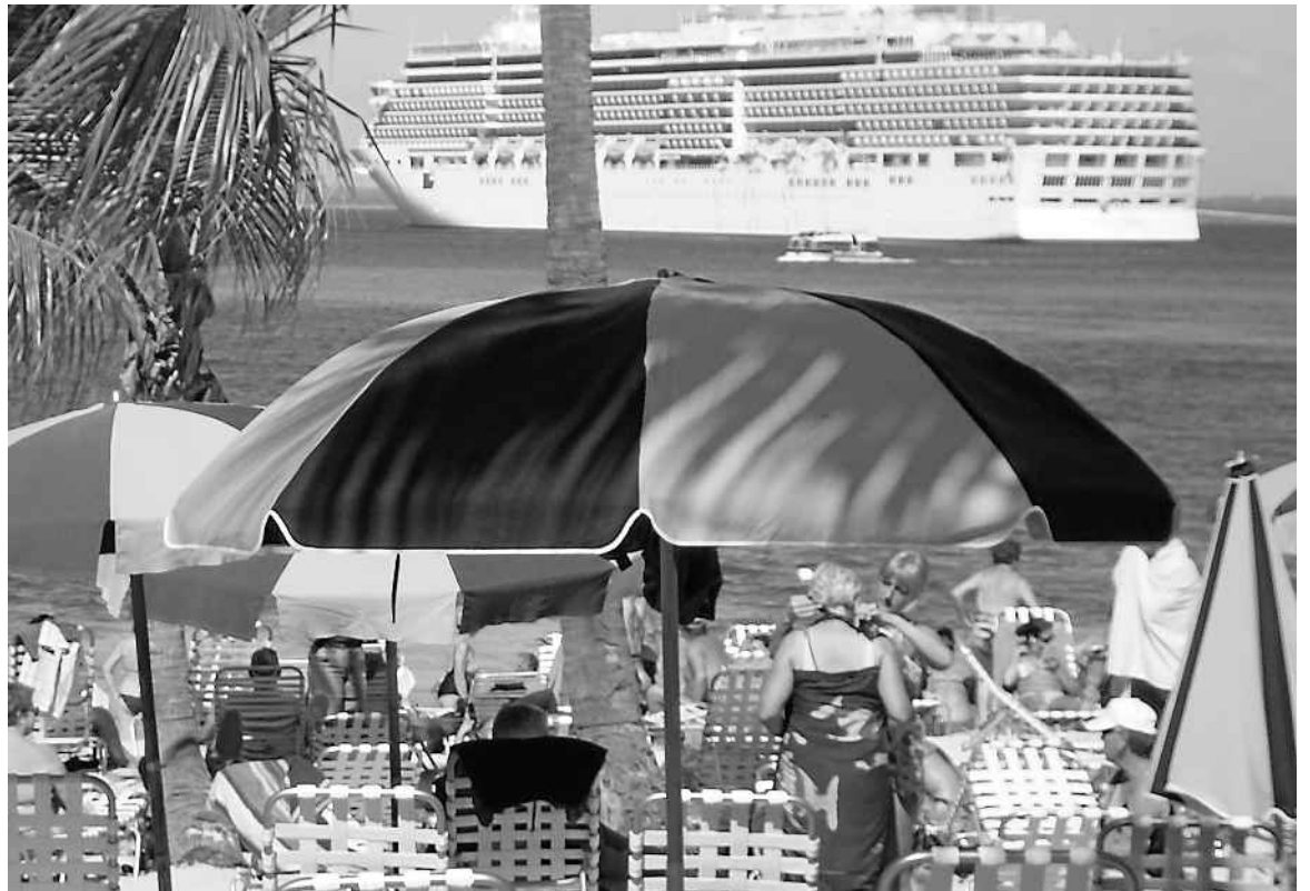
Le Costa Luminosa tente de faire oublier le cauchemar vécu en Italie par le Costa Concordia.