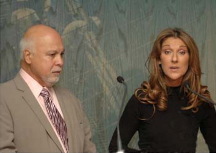
René Angélil et Céline Dion

Céline Dion et René Angélil ont profité de leur séjour au Québec durant l'actuelle période des fêtes pour participer à l'annonce des résultats de la campagne de levée de fonds de la Fondation de l'Hôpital pour enfants Sainte-Justine de Montréal. La somme recueillie atteint 125,4 millions$ ce qui dépasse l'objectif initial qui était de 100 millions$. Un regard sur la liste des donateurs démontrent que tout le Québec Inc. a contribué de même que le grand public en général. Céline et René étaient marraine et parrain de la campagne. Il fallait voir la popularité du couple lors de la conférence de presse tenue au centre hospitalier devant des enfants et des membres du personnel. LeStudio1 était sur place et nous vous présentons un reportage photo complet de l'événement ainsi que d'autres photos exclusives du fameux couple. www.leStudio1.com/CelineDion1