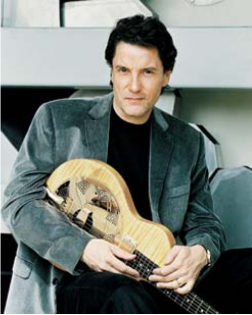
Francis Cabrel

Le chanteur Francis Cabrel est comme son compatriote Gérard Depardieu un vigneron à ses heures. En effet, le chanteur qui a vendu plus de 1 600 000 albums au Canada depuis la fin des années 70 a lancé au Québec, une semaine après Depardieu, une série de 5 vins provenant du sud-ouest de la France et distribués par les Vins de l'Échanson. Ces vins sont disponibles en magasins SAQ, en particulier dans les Sélections. Cabrel a également lancé un nouveau DVD de sa tournée Les Bodegas. En tout 23 chansons mais aussi un documentaire d'une heure portant sur l'enregistrement de l'album Les Beaux Dégâts. On peut voir le chanteur dans son vignoble en pleine campagne du sud-ouest de la France. En prime, on y retrouve également Garou pour un duo sur la chanson La dame de Haute-Savoie.