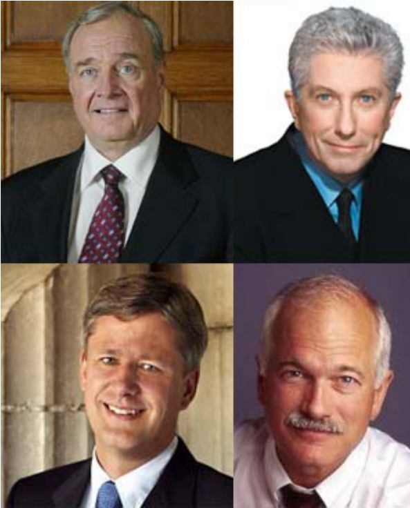
Paul Martin, Gilles Duceppe, Stephen Harper, Jack Layton.

LeStudio1 a visité les différents sites Internet des quatre principaux partis politiques qui se font la lutte dans la présente campagne électorale canadienne. La campagne électorale ne semble pas suivre le rythme des américains alors que les sites Blogs avait joué un rôle très significatif dans le déroulement de leur campagne. Chacun des grands partis canadiens opère un site relativement dynamique mais le débat ne semble pas se dérouler à ce niveau. Le Parti libéral a probablement le site le plus complet des quatre partis tandis que celui du Parti Néo-Démocrate offre le moins d'interaction. Le Parti libéral utilise beaucoup de couleurs et son site ressemble à un journal en ligne avec des photos et des commentaires officiels. Le Bloc, qui avait le meilleur site lors de la dernière élection, offre encore un blogue avec Gilles Duceppe. Le vote se déroulera le 23 janvier prochain.