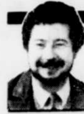
par Raymond GIROUX

Dépêchez-vous, amateurs d'alcool et de drogues: LE SOLEIL vient d'annoncer, dans le tabloïd sports de vendredi, une offre d'emploi à votre portée.