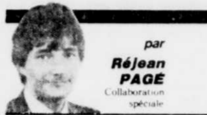
par Réjean PAGE Collaboration spéciale

◆ Lors de vos dernières sorties dans les clubs, discothèques où bars de la région, vous avez sans doute remarqué que les vidéoclips qui y sont présentés, affichaient le logo d'un nouvel organisme de distribution ayant pour nom: le Réseau Vidéo.