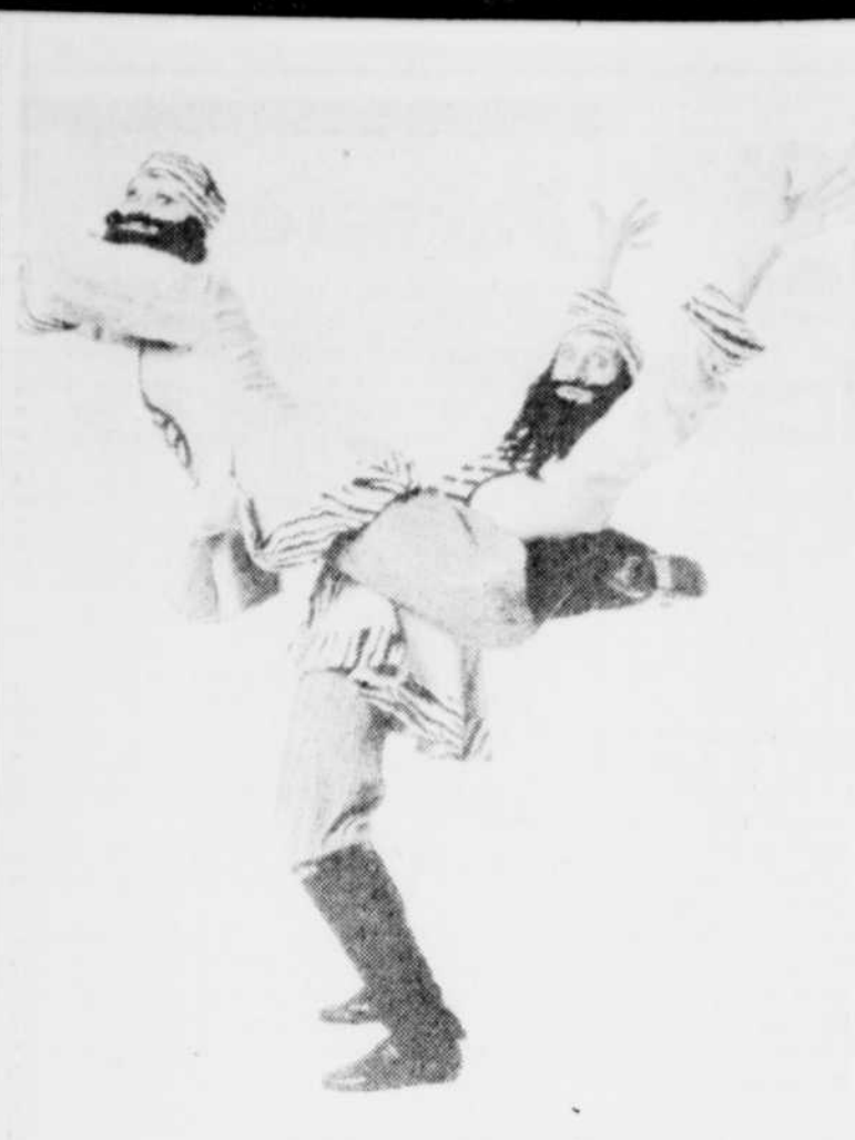
L'American Ballet Comedy a fait un bel effort d'adaptation au public de Québec, lors du numéro des frères Molotov, en faisant allusion aux frères Stastny...