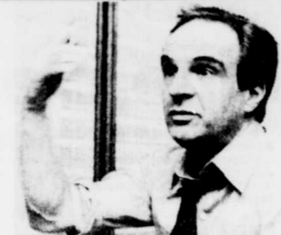
Collaboration spéciale, Michel Parent

Ainsi, sa prodigieuse signature: ouverte, large et généreuse, se voyait confirmée d'un énergique trait barré, horizontal, capable de tenir tête aux plus obstinés de ses proches; en regard d'une passion d'être: à reconfrimer, toujours! En 1980, par le biais d'un entrefilet dans "Le monde littéraire", François Truffaut apprenait la tenue imminente d'un colloque international, consacré à Louis Hémon. Aux éminences grises de cet événement brestois, à la fois culturel et littéraire, le cinéaste exprime alors sa vive déception, de ne pouvoir participer aux délibérations; lesquelles se tenaient justement en