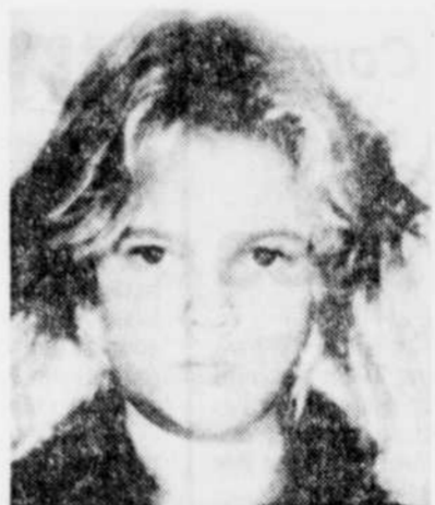
Charlie McGee, l'enfant terrible de Firestarter , le vidéo de la semaine à Québec.

pertes d'argent considérable en raison des droits d'auteurs ainsi violés. Déjà, les procès se multiplient dans plusieurs villes de France et les verdicts seraient plutôt sévères. Un procès qui s'est tenu à Paris récemment donnera à réfléchir aux aspirants pirates. Le gérant d'un club vidéo parisien s'était permis de reproduire un bon nombre de films dans le seul but d'accroître son inventaire en ne payant que le prix du transfert d'images et de la cassette vierge. Poursuivi par une quinzaine de sociétés, le "pirate" s'est vu réclamer entre 10 000 et 30 000 francs (1 800 à 5 400 dollars) par titre frauduleusement copié. L'addition plutôt "salée" se chiffrait à près de 600 000 dollars. Enfin les organismes officiels auraient décidé de coordonner leurs efforts afin de combattre cette "vague" de copies et d'empêcher ainsi les pirates de monter un "bateau" aux compagnies de production.