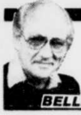
par Roger BELLEFEUILLE

Faute de mieux, les Québécois, dont les jeunes, seront conviés à beaucoup de séances de parlote au cours des prochains mois. Dans une évidente stratégie de visibilité pré-électorale et de verbeux camoufflage, le gouvernement annonce en effet une série de consultations populaires qui devraient toutes, mais cela est moins sûr, déboucher sur des plans d'actions concrètes dans divers secteurs: famille, habitation, emplois des jeunes, entre autres croisées, pour le moment du moins.