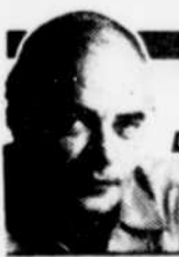
par Laurent LAPLANTE (collaboration spéciale)