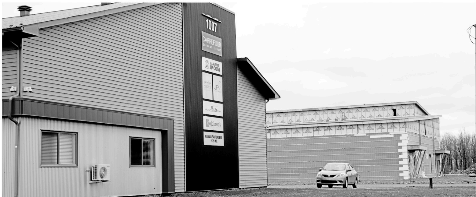
Trois nouvelles entreprises devraient s'implanter cette année dans le parc industriel et commercial de Saint-Alphonse-de-Granby. Il reste moins d'une dizaine de terrains disponibles avant que le parc soit complet.

L'économie se porte assez bien du côté manufacturier et des distributeurs-grossistes dans Saint-Alphonse. Dans une enquête menée en 2018, Granby Industriel y a recensé 19 entreprises dans ce créneau sur le territoire. Ces entreprises avaient à leur emploi 630 personnes. En 2017, on comptait 20 entreprises de ce créneau économique et 614 employés y travaillaient.