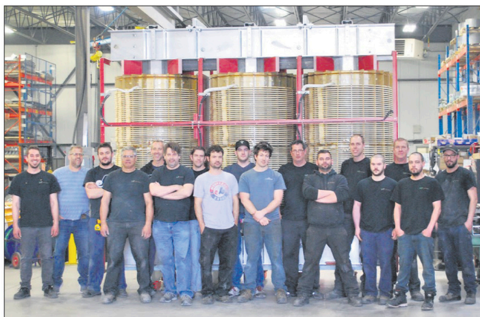
L'équipe ayant contribué au projet du transformateur de 15 MVA pesant plus 72 000 livres.

Au cours de la prochaine année, WR Transformateurs prévoit investir 3,5 M $ en infrastructure et équipement. La phase 1 est déjà lancée et devrait se terminer d'ici quelques semaines. La phase 2 devrait débuter au début du mois de juillet et se terminer vers la fin d'octobre 2019. Le processus de production revu en version 4.0 est l'objectif visé par l'entreprise.