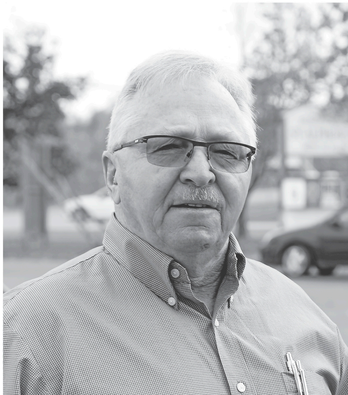
La maire de Saint-Alphonse, Marcel Gaudreau.

Depuis, la municipalité a investi 1,9 million de dollars pour reconfigurer la rue Denison Ouest et procéder à des travaux de dynamitage et de concassage de caps rocheux.