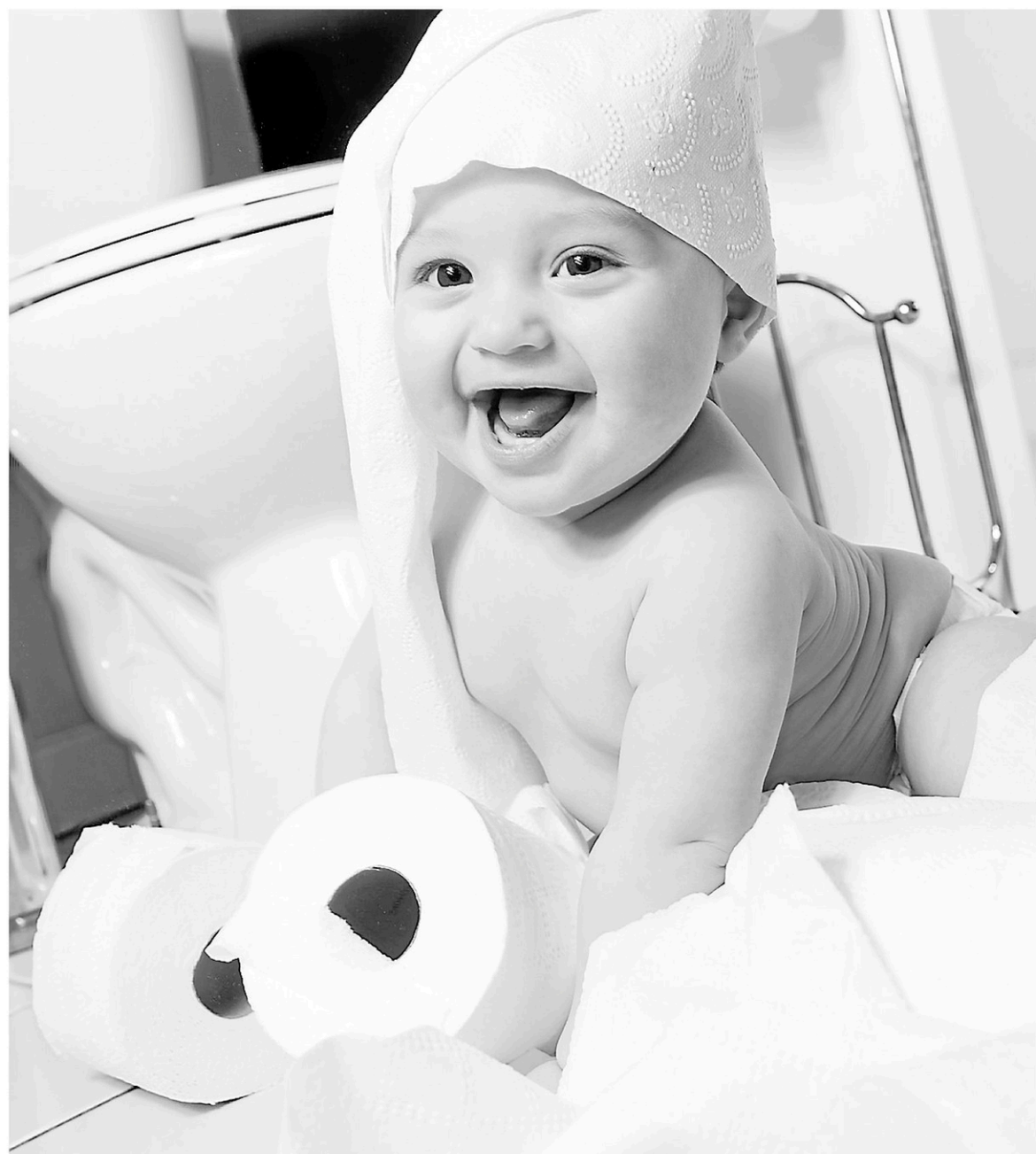
Les deux principaux secteurs d'activité que dessert actuellement TKM Canada sont la production de papier hygiénique et le recyclage, principalement le plastique.

«Ces deux industries bougent beaucoup, mentionne le directeur des ventes. Avant, les usines de fabrication recyclaient leur matériel qui était ensuite réutilisé pour faire d'autres contenants. Avec la venue des usines de recyclage, plusieurs compagnies se tournent vers ces sous-traitants. Ça a pris beaucoup d'amplitude avec les normes environnementales. Les gouvernements subventionnent massivement ces créneaux. On voit de nouveaux équipements, de nouvelles usines. La demande est forte et on mise sur cette croissance à long terme.»