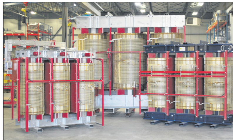
Produits typiques réalisés par WR Transformateurs.

WR Transformateurs inc. est un fabricant de transformateurs électriques de type à sec. Au fil des années, l'entreprise a su se démarquer en fabricant et en offrant des produits adaptés aux demandes spécifiques de ses clients tout en les soutenant dans l'ensemble de leurs projets. Bien que la grande part de son marché se retrouve au Québec, WR a réalisé de nombreux projets de prestige ici et ailleurs dans le monde. L'équipe de WR Transformateurs a notamment contribué au développement électrique d'une île dans les Bahamas servant à accueillir quotidiennement des bateaux de croisière. Elle a aussi réalisé un projet clé en main de 15 mégawatts pour un Centre locatif de haute densité à Baie Comeau.