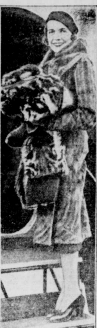
Lady Louise MOUNTBATTEN, appartenant de la famille royale, photographiée au moment où elle prend l'avion à l'aéroport de Newark, pour Hollywood où elle visitera des amis dans la colonie du film.