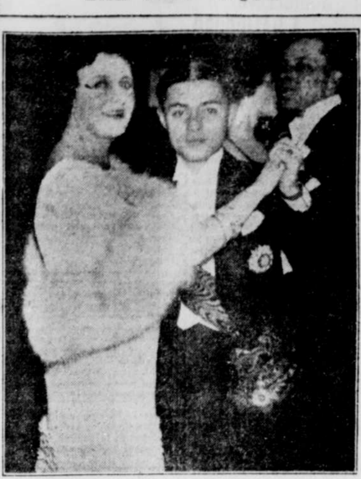
Plusieurs célébrités étrangères ont assisté au récent bal au profit des vétérans à Londres, C.-B. Les princes héritiers de Siam dansent avec Lady Dalrymple (M. AMFNEYS). Le bal eut lieu à Grosvenor House et un toast fut porté à la santé du roi. C'était la première fois que pareille chose se produisait dans cette vieille salle, depuis la veille de la bataille de Waterloo.