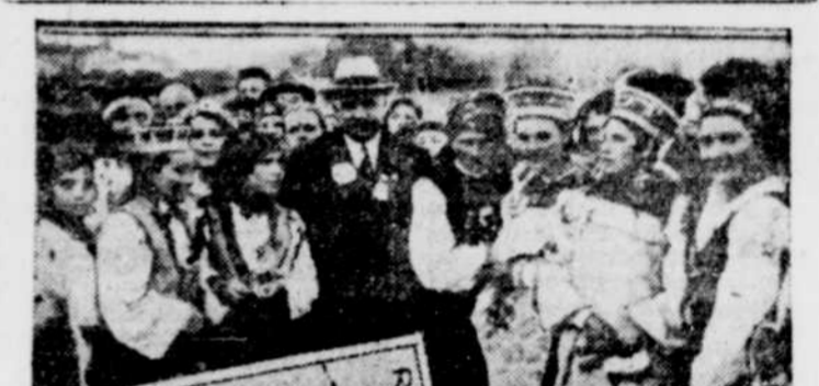
Karlis ULMANIS, chef de la république de Letonie, diplômé de l'Université du Nebraska, est un admirateur du "New Deal" de Roosevelt. Ci-dessus, à gauche, Ulmanis lorsqu'il était étudiant et, à droite, tel qu'il est aujourd'hui. En haut, le chef de la Letonie au milieu de son peuple chez qui il est très populaire.