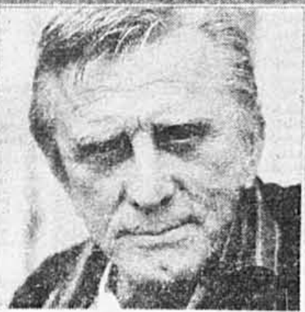
Presses de la Renaissance