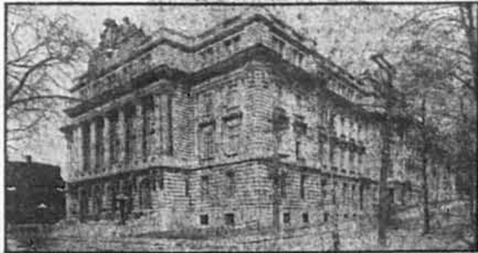
Les murs sud et est de l'école en 1935.

L'édifice d'origine épouse la forme d'un «J» construit en bordure de l'avenue Viger et de la rue Saint-Hubert, avec de courtes sections rue de La Gauchetière et rue Labelle. Le bâtiment d'esprit victorien qui se trouve à l'angle sud-est des rues Labelle et de La Gau-