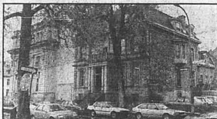
L'arrière de l'ensemble, aujourd'hui.