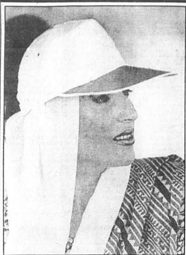
Le premier ministre du Pakistan, Benazir Bhutto