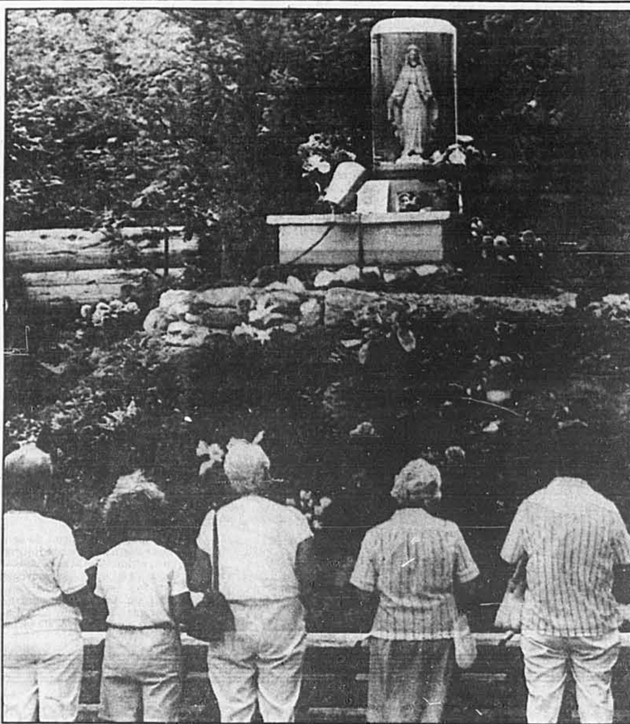
La statue qui, dit-on, aurait bougé pendant la récitation du chapelet, à Saint-Frédéric de Beauce.