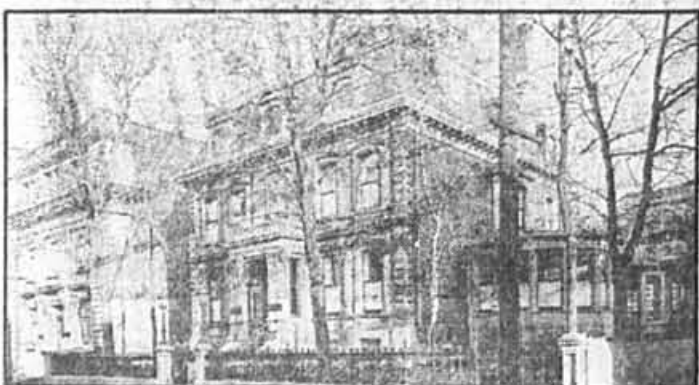
La face nord et l'ex-résidence du directeur, rue de La Gauchetière, en 1935.

Ces articles sont offerts sous forme de livres par les Éditions La Presse, sous le titre Montréal, son histoire, son architecture. Renseignements: Guy Pinard, au 285-7070.