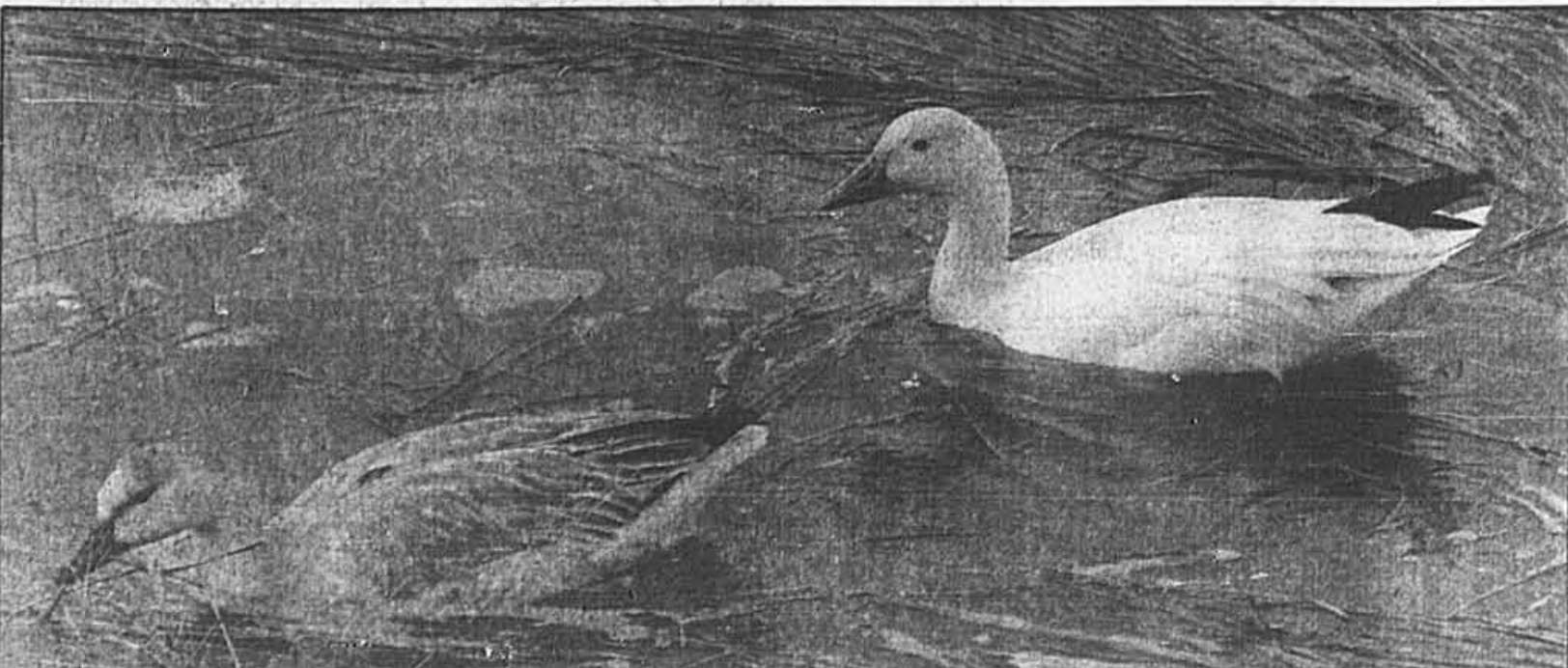
Les oies blanches se laissent facilement observer au quai de Montmagny, comme en témoigne cette photo. Les jeunes de l'année sont gris.

Un dernier mot: si vous avez la chance d'observer un spécimen porteur d'un collier, lisez attentivement les chiffres et faites part de votre découverte au département de biologie de l'Université Laval (tél: 418-656-3180) en précisant l'endroit et les circonstances de votre trouvaille, en mentionnant entre autre si l'oiseau faisait partie d'un groupe ou d'une famille (les oies se tiennent en famille) ou seul.