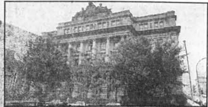
La façade de l'école aujourd'hui.

L'ordonnance verticale de la façade comprend neuf travées, et cinq se trouvent dans l'avant-corps. Chacune de ces cinq travées comprend une ouverture cintrée et avec clé de voûte proéminente au rez-de-chaussée; une porte-fenêtre surmonté d'un enablement sur console au premier et s'ouvrant sur un balcon à balustres sculptées dans la pierre; une fenêtre rectangulaire au deuxième; et deux petites fenêtres rectangulaires séparées par un pilastre au troisième. Au premier et deuxième étages, les encadrements des croisées sont en pierre moulurée. Les trois travées du centre sont couronnées par une magistrale pièce ornementale comportant deux figures de couronnement couchées (dont Mercure), de chaque côté d'un écu surmonté d'une imposante volute et contenant les armoiries de l'école, le tout culminant à 90 pieds. Les pleins comportent une imposante volute (deux aux extrémités de l'avant-corps) au rez-de-chaussée, une colonne galbée à chapiteau ionique ornementé de pendants au niveau du troisième