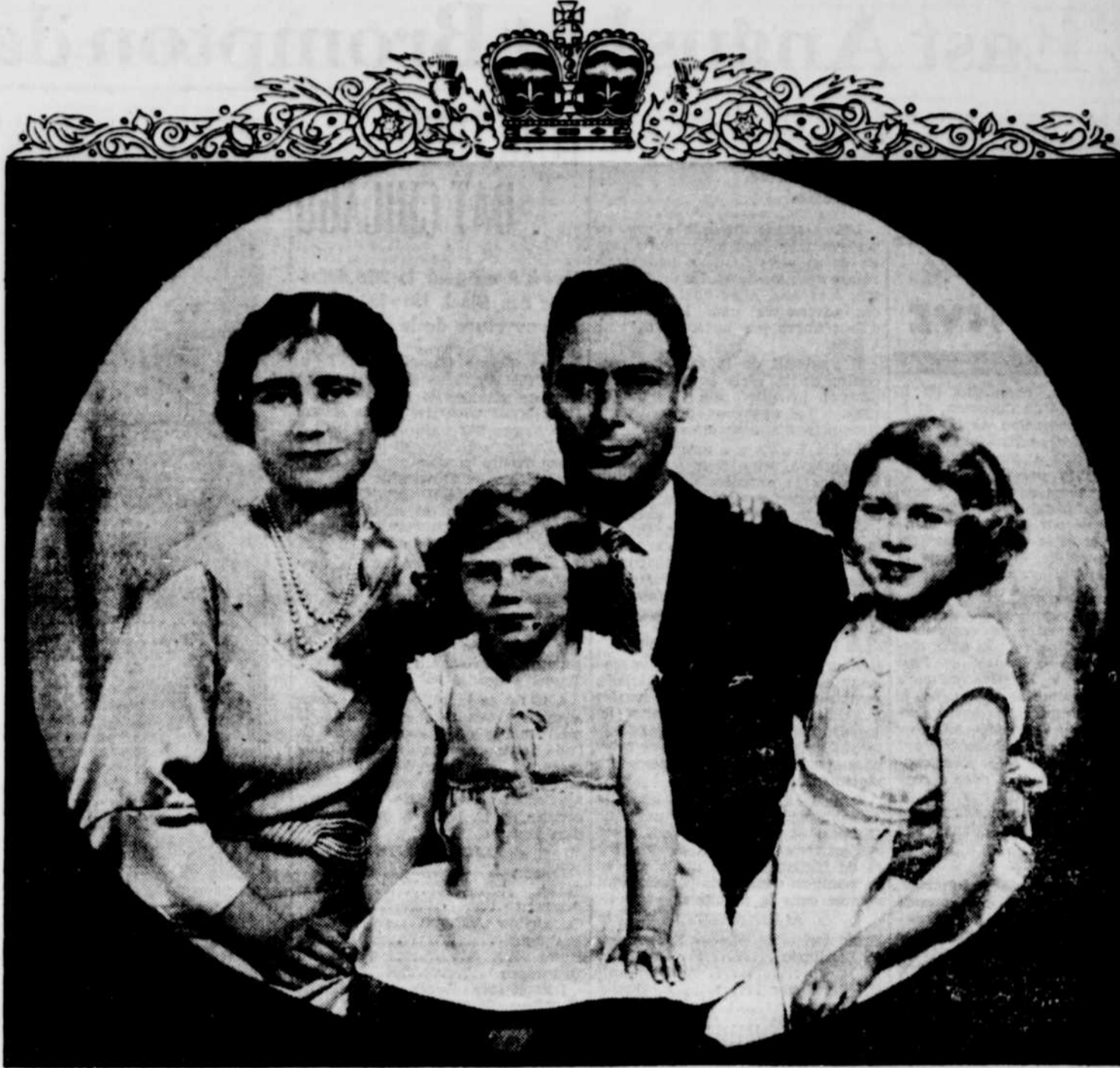
Voici l'un des plus charmants portraits de famille que l'on ait pris de la famille royale d'Angleterre. On voit ici de gauche à droite leurs Majestés la reine ELIZABETH et le roi GEORGES VI, avec leurs deux enfants, les princesses ELIZABETH et MARGARET ROSE. La famille royale est un exemple typique du bonheur familial, et c'est pour cette raison qu'elle est chérie de toutes les populations de l'Empire britannique.