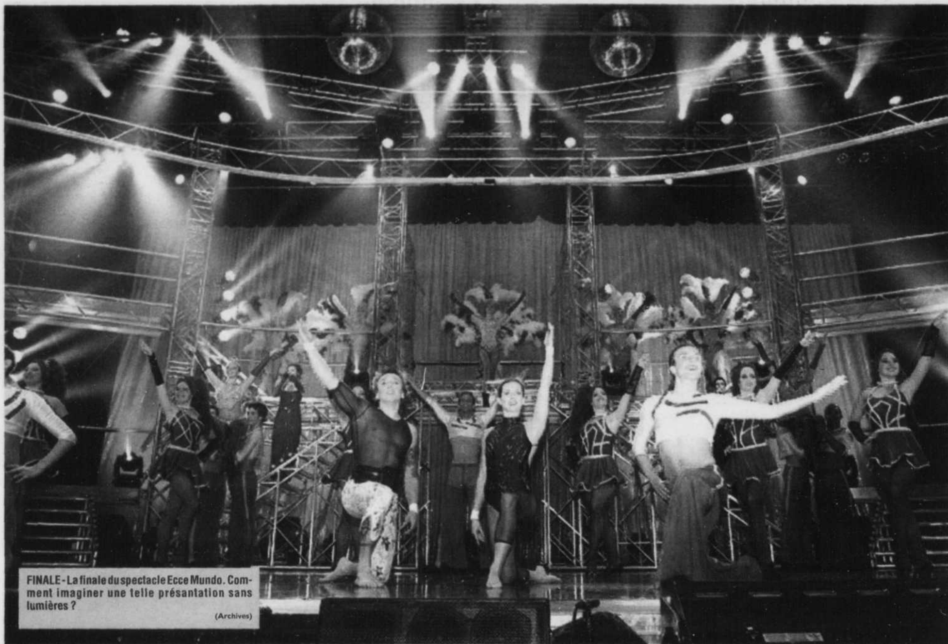
FINALE - La finale du spectacle Ecce Mundo. Comment imaginer une telle présentation sans lumières ?