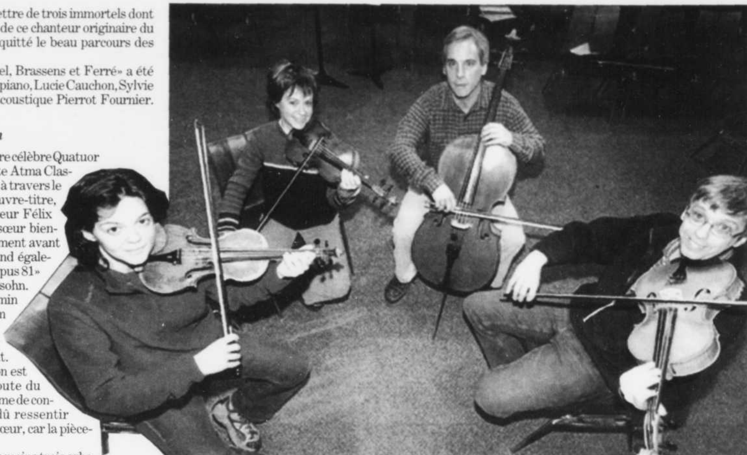
DISQUE - Mercredi dernier, le 11e disque du Quatuor Alcan, «Requiem für Fanny», était mis en vente chez les disquaires à travers le Canada, les États-Unis et l'Europe.

Ce disque est le deuxième d'une série d'au moins trois arborant l'étiquette Atma Classique, marquant la collaboration entre les musiciens et cette compagnie.