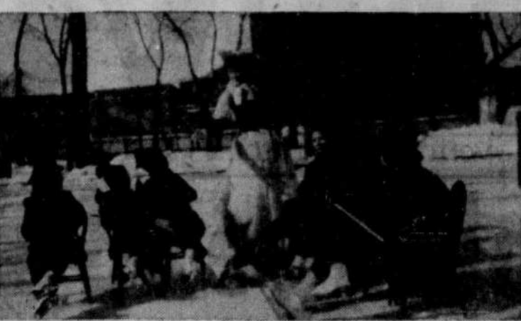
Les étudiantes du Pensionnat de l'Ange-Gardien ont marqué le Mardi-Gras par un brillant festival organisé sous les auspices de Santé-Loisirs dont la principale attraction était une mini-aur glacia racontant l'histoire de Blanche-Neige et des sept petits nains.

Celles qui se plaignent d'être trop grandes ont tort de le faire. La jeune fille élancée et svelte portera souvent mieux que tout autre le tailleur élégant, la création originale que sa soeur de cinq pieds cinq pouces et moins n'osera même pas essayer.